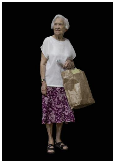
2 MenschenBild #7, 2010