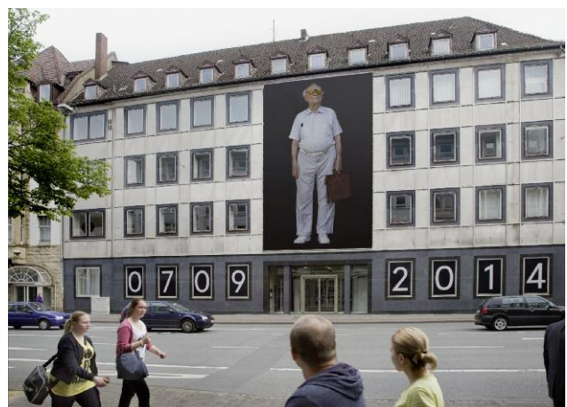
6 MenschenBild #4, 2007, 7 x 10 m, Ehemalige Stadtbibliothek, Bielefeld im Rahmen der Ausstellung Die Bielefelder Schule. Fotokunst im Kontext, 2014 © EMANUEL RAAB