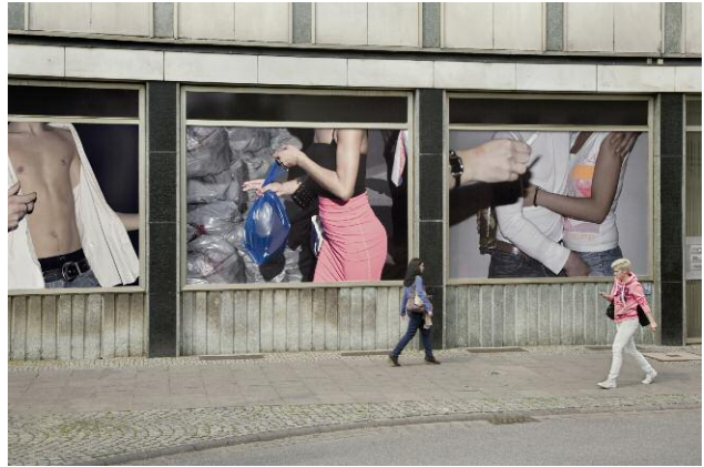
8 KörperSchau #6, #7, 2013, je 3 x 4 m, Ehemalige Stadtbibliothek, Bielefeld im Rahmen der Ausstellung Die Bielefelder Schule. Fotokunst im Kontext, 2014