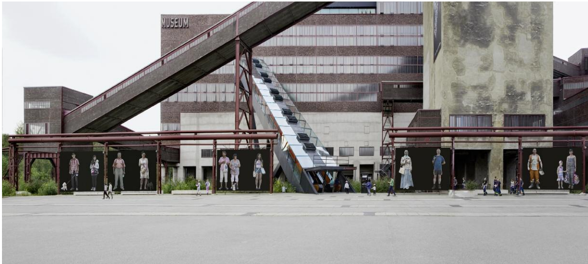
1 MenschenBild #22–#31, 2012/13, je 4 x 7 m (Simulation), UNESCO-Welterbe Zollverein, Essen 2015 © EMANUEL RAAB