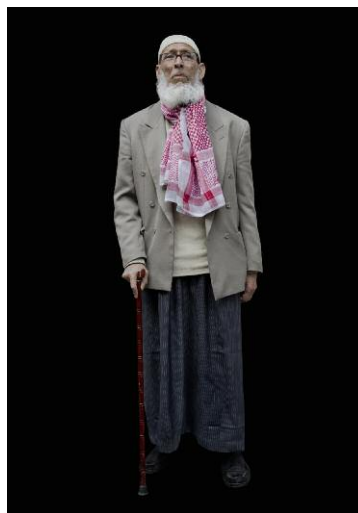
3 MenschenBild #35, 2013