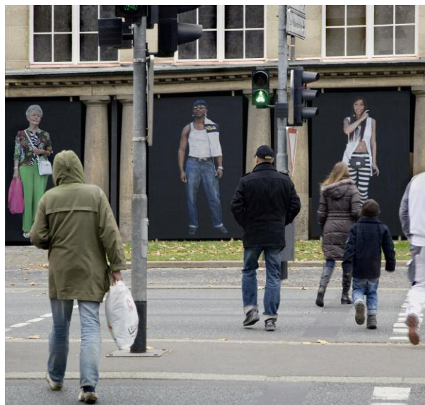
5 MenschenBild #8, #9, #12, 2011, je 2 x 3 m, Museum Wiesbaden 2011/12 © EMANUEL RAAB