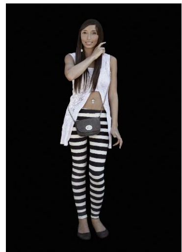
4 MenschenBild #12, 2011 © EMANUEL RAAB