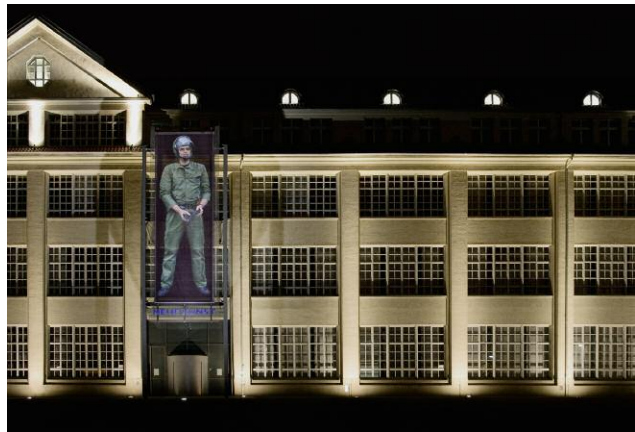
10 MenschenBild #5, 2007, 3 x 10 m, ZKM | Karlsruhe im Rahmen der Ausstellung Vertrautes Terrain – Aktuelle Kunst in & über Deutschland, ZKM | Zentrum für Kunst und Medientechnologie © EMANUEL RAAB