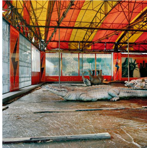
2 Amerika Autodrom, 2006 ©Frank Robert