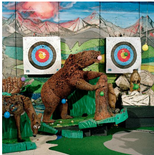
4 Daytona Beach, 2015