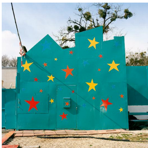
5 Haus mit Sternen, 2008 ©Frank Robert