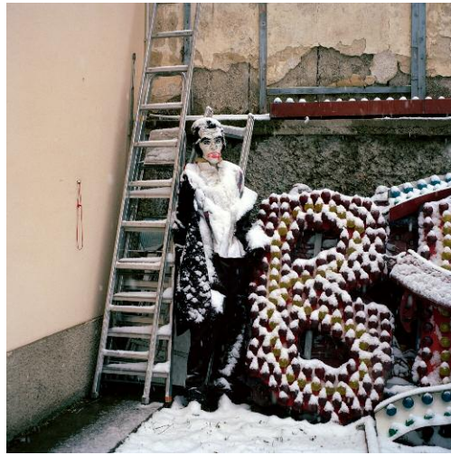
8 Dracula, 2013 ©Frank Robert