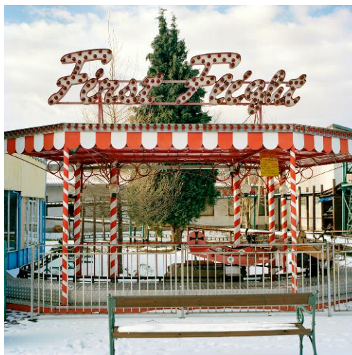
6 First Flight, 2006 ©Frank Robert