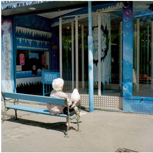
7 Spiegelkabinett, 2007 ©Frank Robert