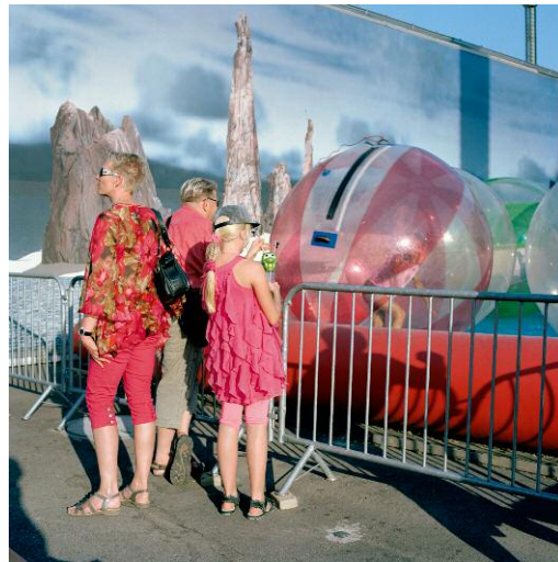
10 Aqua Ball, 2015