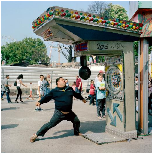
1 Mann am Boxautomat, 2013