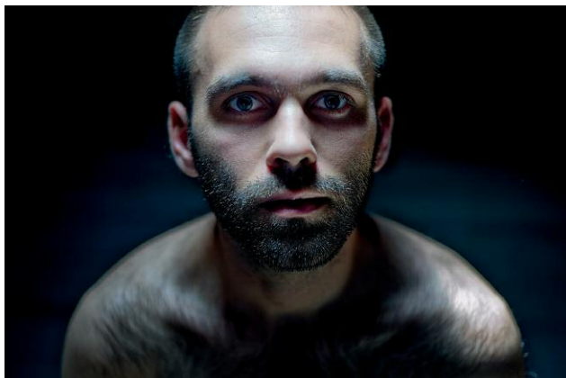
Diptych 2 - The Cicada's Song (3. Untitled 15, Who Will Look After Me) © Eric Tchéou