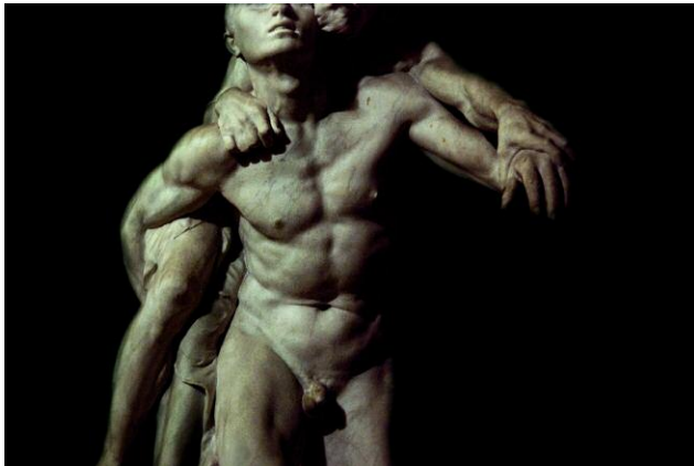
Diptych 5 - The Cicada's Song (9. Untitled 4, The Universe Is a Dream) © Eric Tch  u