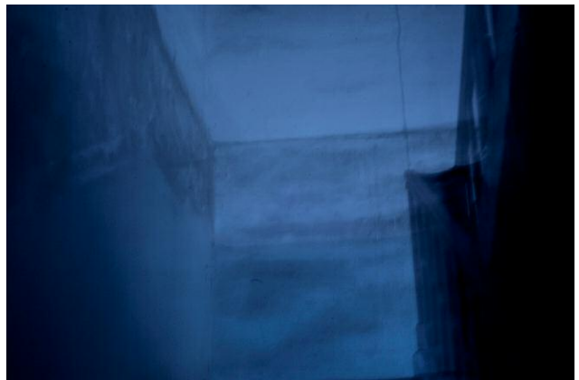
Diptych 2 - The Cicada's Song (4. Untitled 17, Who Will Look After Me) © Eric Tchéou