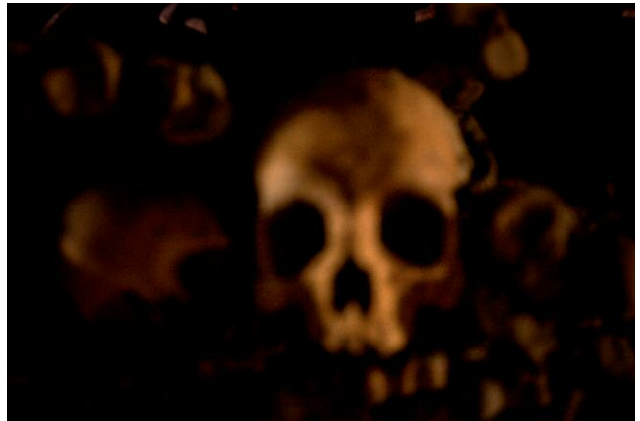
Diptych 1 - The Cicada's Song (2. Paris, I Was Here) © Eric Tchéou