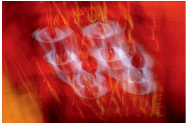
Diptych 6 - The Cicada's Song (12. Alpe d'Huez, I Was Here) © Eric Tch  u