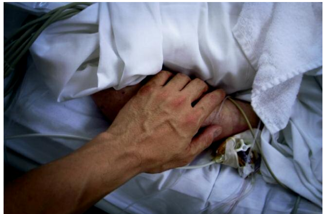
Diptych 5 - The Cicada's Song (10. St Joseph's Hospital, Paris) © Eric Tch  u