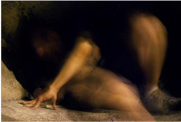
Diptych 1 - The Cicada's Song (1. Untitled 18, Coalescence) © Eric Tchéou