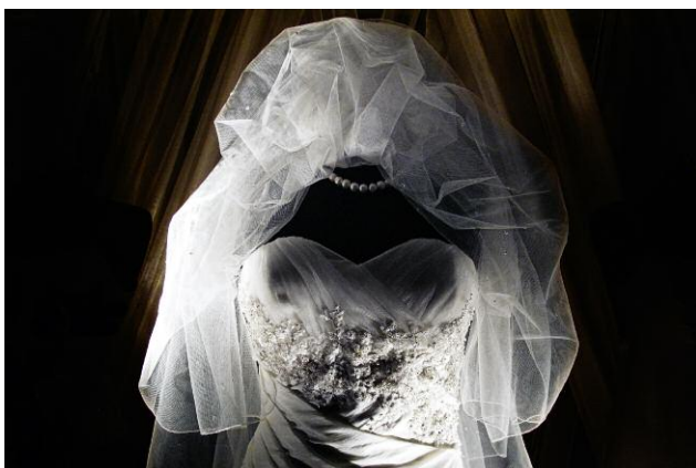
Diptych 3 - The Cicada's Song (5. Richmond, That Which Does Not Kill You) © Eric Tchéou