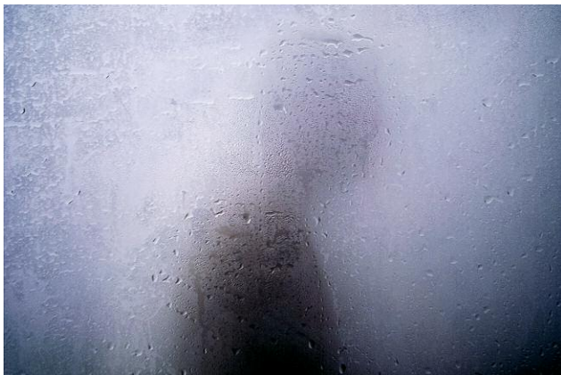
Diptych 6 - The Cicada's Song (11. London, That Which Does Not Kill You) © Eric Tch  u