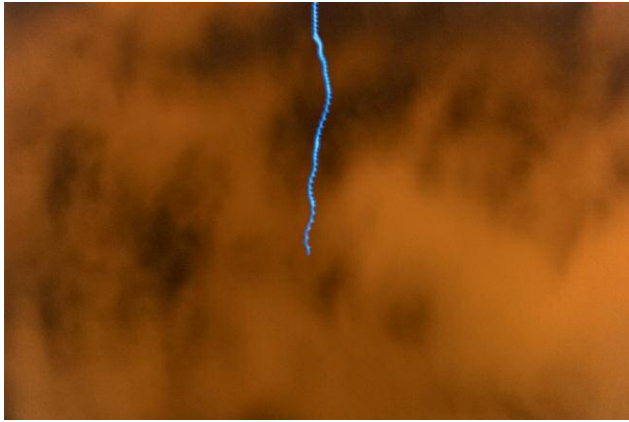
Diptych 4 - The Cicada's Song (7. Venice, I Was Here) © Eric Tch  u