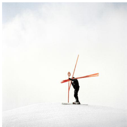
5. Bettmeralp / 2013