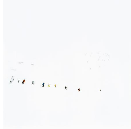
4. Verbier / 2011