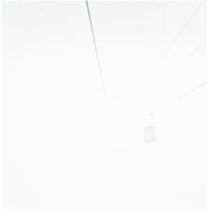
1. Verbier / 2012