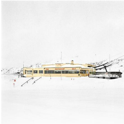
7. Saint-Bernard / 2013 © François Schaer