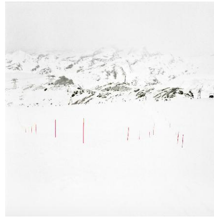
2. Zermatt / 2013