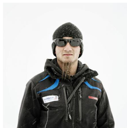
12. Verbier / 2012 © François Schaer