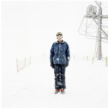
3. Arolla / 2012