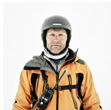
6. Nendaz / 2013 © François Schaer