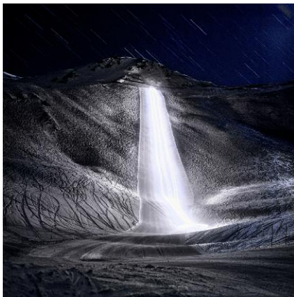
9. Zinal / 2012