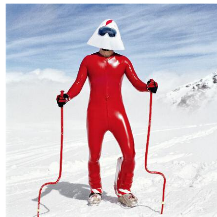
10. Verbier / 2012