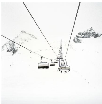
11. Zermatt / 2013