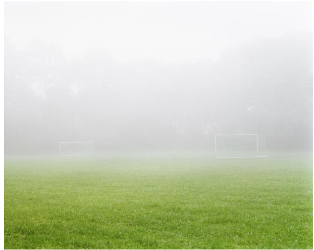
Tore II 2009