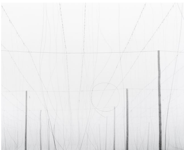
Hopfen V 2011