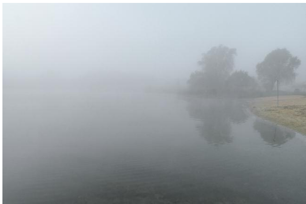
Beetzer See 2010