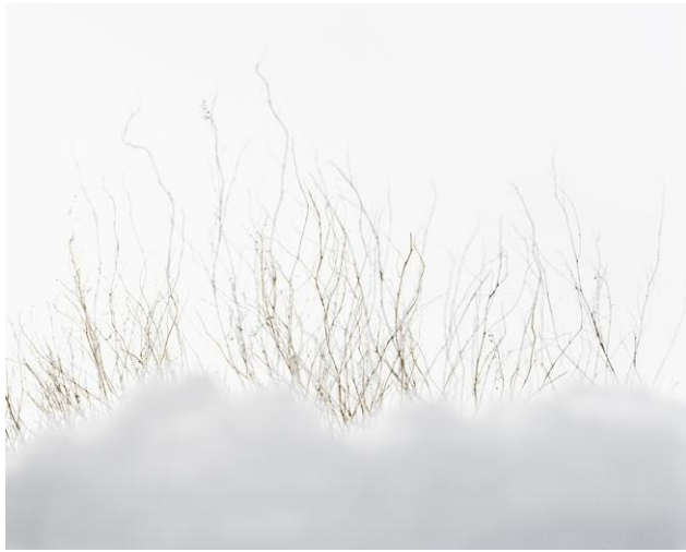
Untitled XVIII (Botanik) 2011