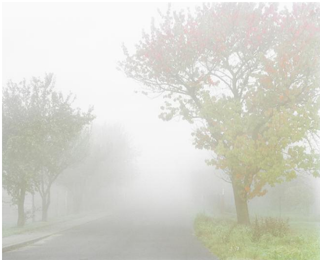
Wall II 2010