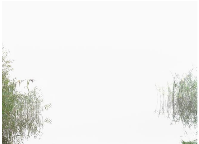
Schilf IV 2009