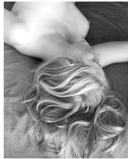
2. Imogen Cunningham, Phoenix Recumbent / Phoenix liegend, 1968