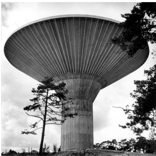
10. Imogen Cunningham, Finland Water Tower / Wasserturm in Finnland, 1961 ©The Imogen Cunningham Trust