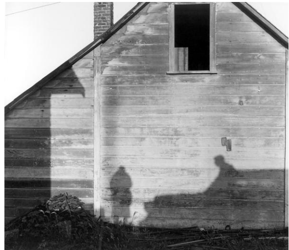
9. Imogen Cunningham, Self-Portrait, Mendocino / Selbstporträt, Mendocino, 1965