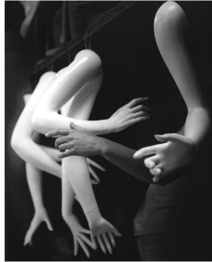
1. Imogen Cunningham, Another Arm / Noch ein Arm, 1973