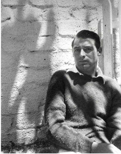
6. Imogen Cunningham, Cary Grant, Actor / Cary Grant, Schauspieler, 1932