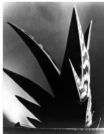
5. Imogen Cunningham, Aloe, 1925 ©The Imogen Cunningham Trust