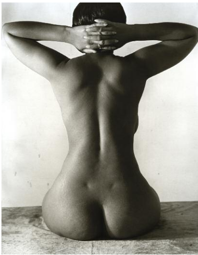
2. Imogen Cunningham, Nude / Akt, 1939 ©The Imogen Cunningham Trust