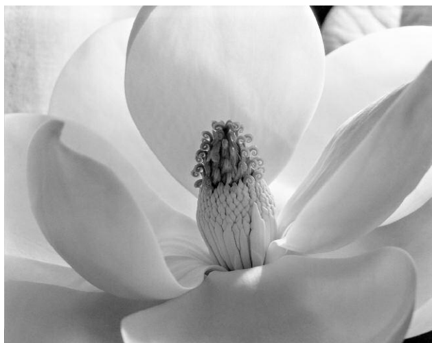
4. Imogen Cunningham, Magnolia Blossom / Magnolienblüte, 1925 ©The Imogen Cunningham Trust