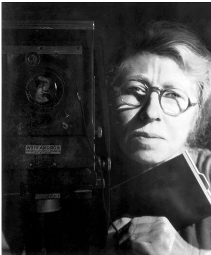
8. Imogen Cunningham, Self-Portrait with Korona View / Selbstporträt mit Korona View, 1933