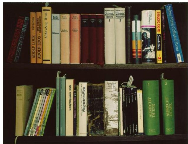
10_Gregor Schmoll Aus der Privatsammlung (PS.WHFT.2010.II – Talbot), 2010