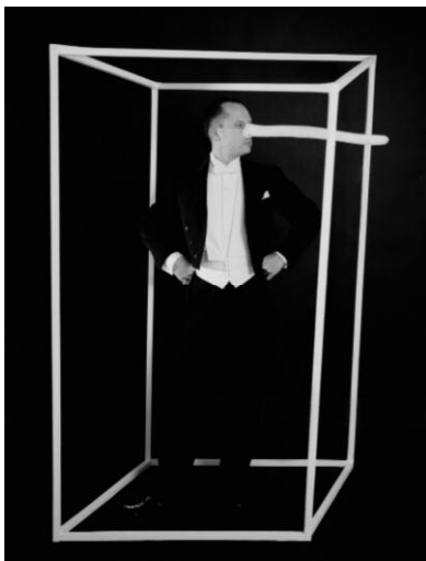
9_Gregor Schmoll Jack-in-the-Box, aus der Serie „The Adventurous Journeys of Monsieur Surrealist: The Moone“, 2005 © GREGOR SCHMOLL