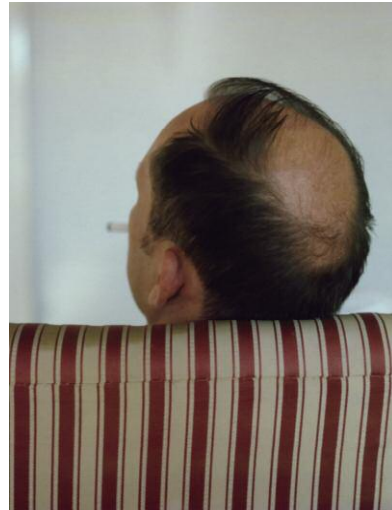
2_Gregor Schmoll Aus der Privatsammlung (PS.MD.2009.I – Duchamp), 2009