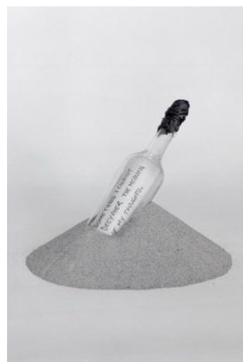
12_Gregor Schmoll Descartes' Hausbrand, aus der Serie „Orbis Pictus“, 2014