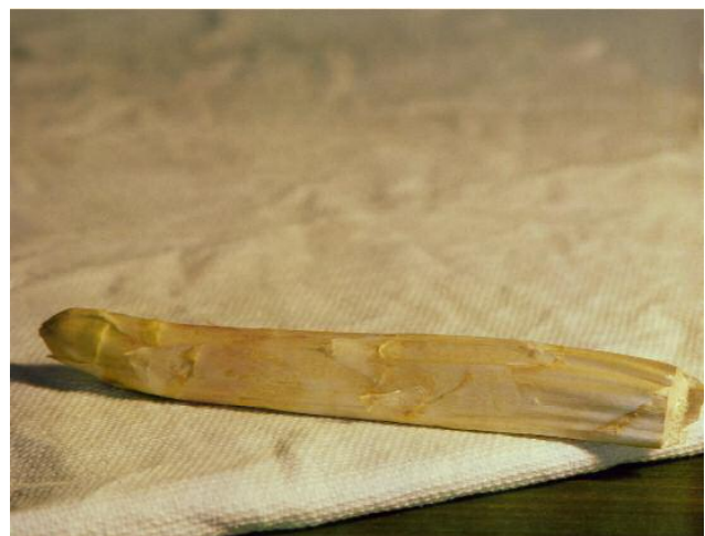
6_Gregor Schmoll Aus der Privatsammlung (PS.EM.2010.I – Manet), 2010