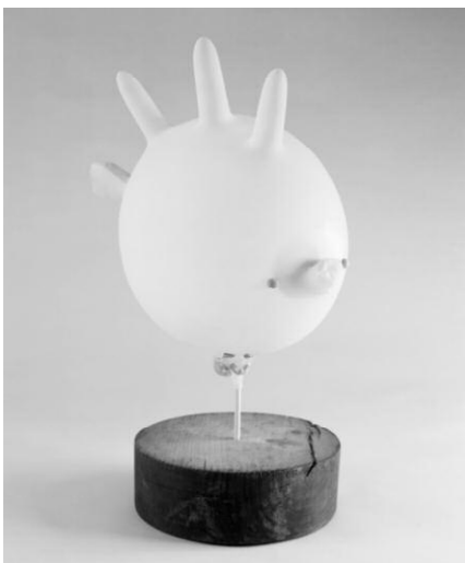
5_Gregor Schmoll Fugu, aus der Serie „Evidence of Dreams“, 2012