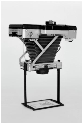
3_Gregor Schmoll Wittgensteins Apparatur, aus der Serie „Orbis Pictus“, 2014