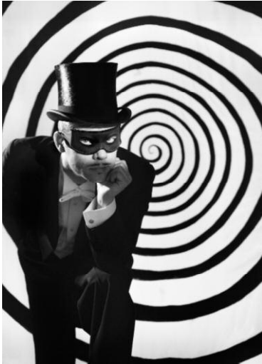
1_Gregor Schmoll Fantômas, aus der Serie „My Life as Monsieur Surrealist“, 2004