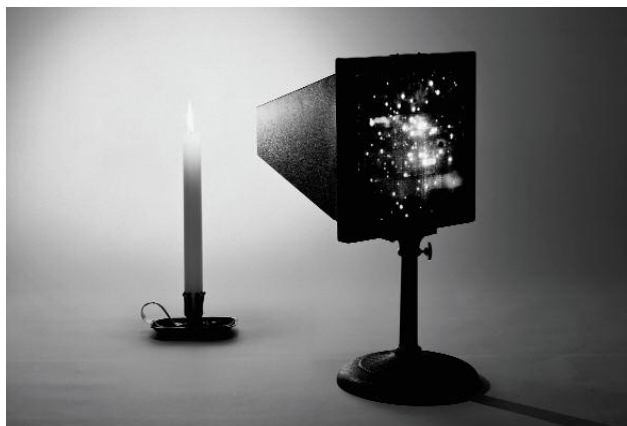
11_Gregor Schmoll Aristoteles' Kinematograph, aus der Serie „Orbis Pictus“, 2014 © GREGOR SCHMOLL