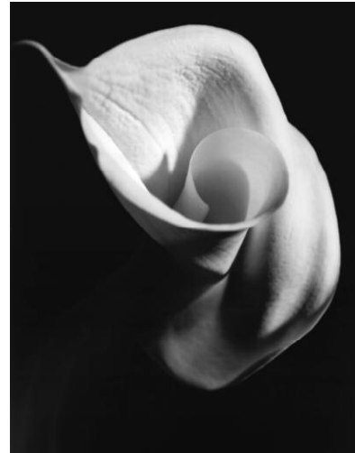
8_Gregor Schmoll Version d'image (F5), aus der Serie „Vexations“, 2007/08