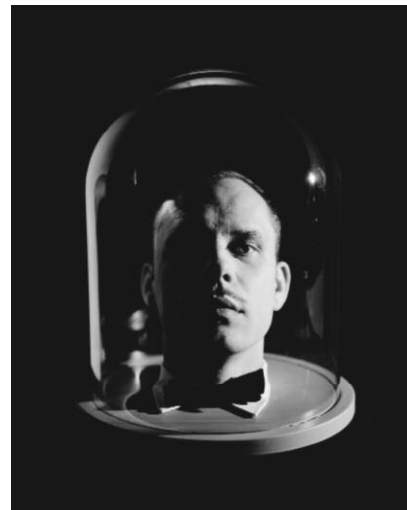
4_Gregor Schmoll Orpheus, aus der Serie „The Adventurous Journeys of Monsieur Surrealist: Die Unterwelt“, 2005