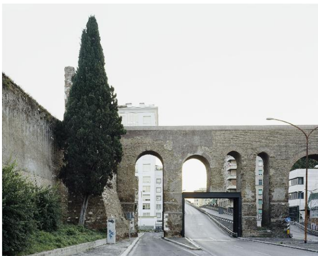
5 Aqua Claudia, Tangenziale Est © Hans-Christian Schink