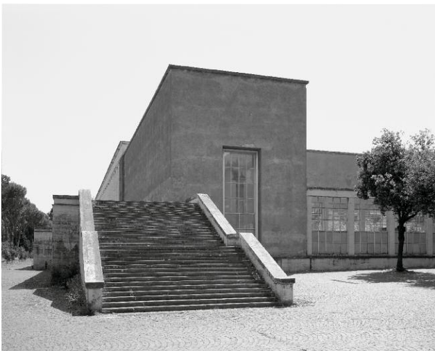
8 EUR, Viale della Scultura