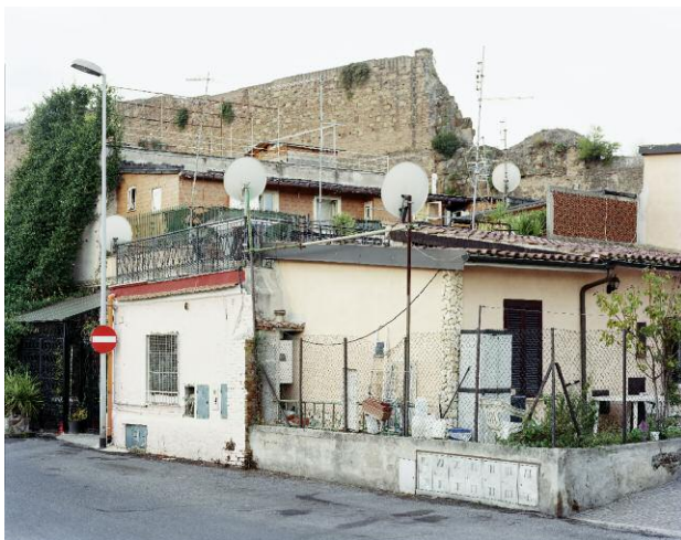
3 Aqua Claudia, Via del Mandrione (4)