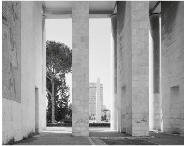
7 EUR, Viale della Civiltà Romana (4)