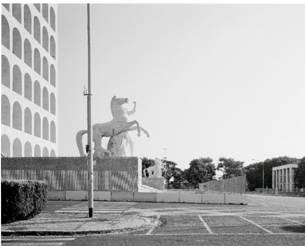
10 EUR, Quadrato della Concordia (2) © Hans-Christian Schink