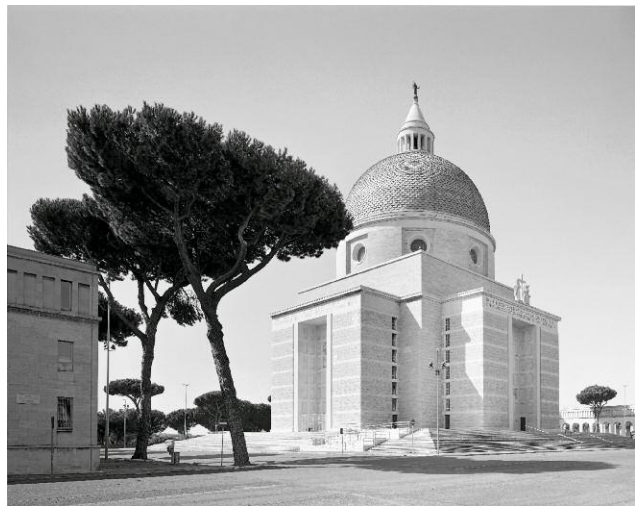
9 EUR, Viale dei Santi Pietro e Paolo