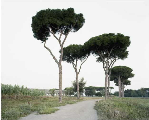
1 Aqua Claudia, Parco degli Acquadotti (1)