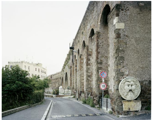
4 Aqua Claudia, Via Casilina Vecchia (1) © Hans-Christian Schink