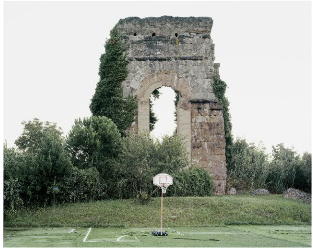
2 Aqua Claudia, Via del Quadraro (2)