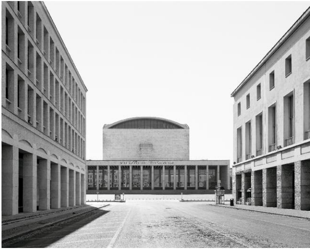
6 EUR, Viale Civiltà del Lavoro (1)