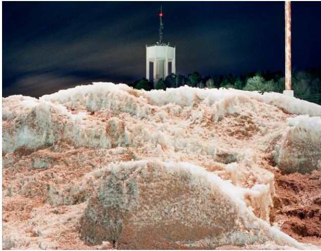
Domusparkeringen, 2010