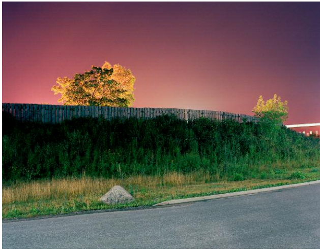
Rättarvägen, 2006