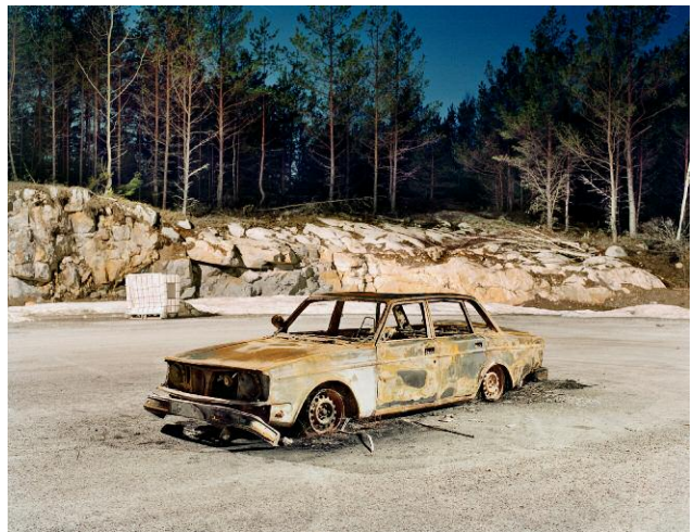
Leveransvägen I, 2010 © HANS MALM