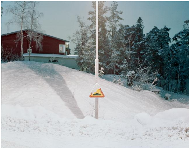
Charlottendalsvägen II, 2010 © HANS MALM