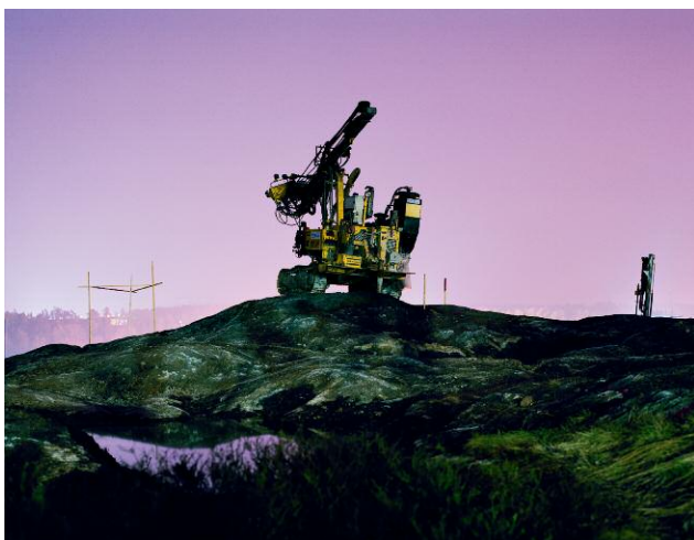
Kvarnberget, 2006