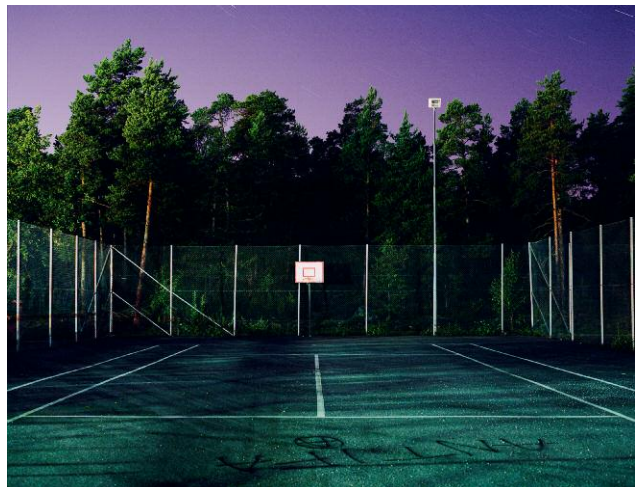
Styrmannen, 2006 © HANS MALM