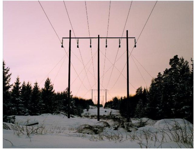
Lillskogen, 2006