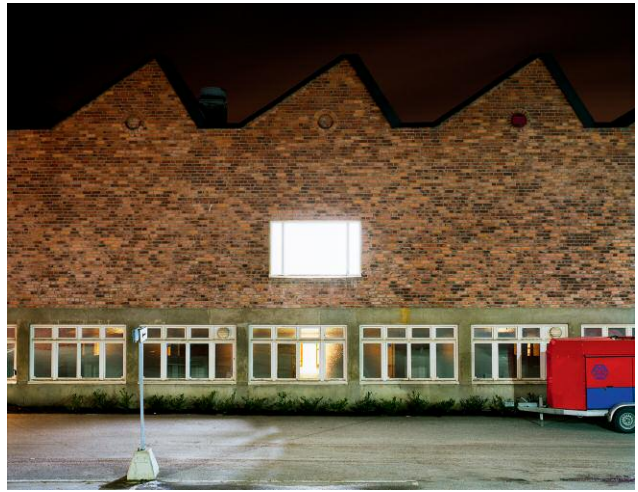
Odelbergs väg, 2005