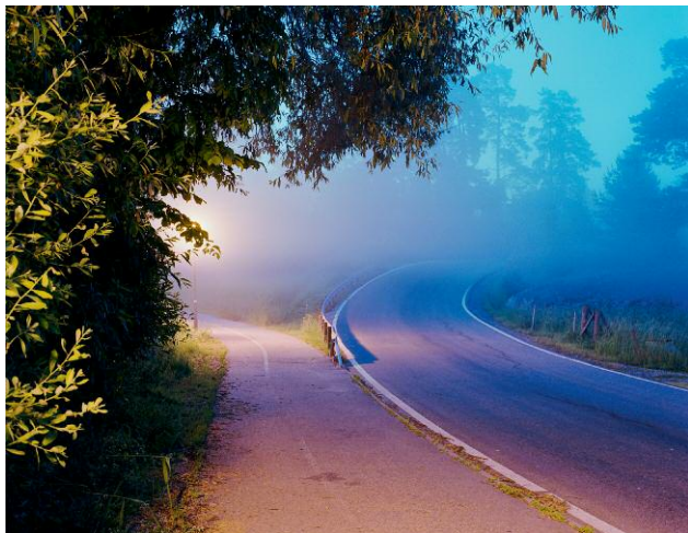
Aspviksvägen, 2006 © HANS MALM