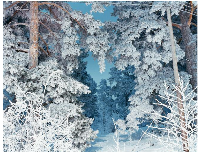
Kvarntorpsvägen, 2011