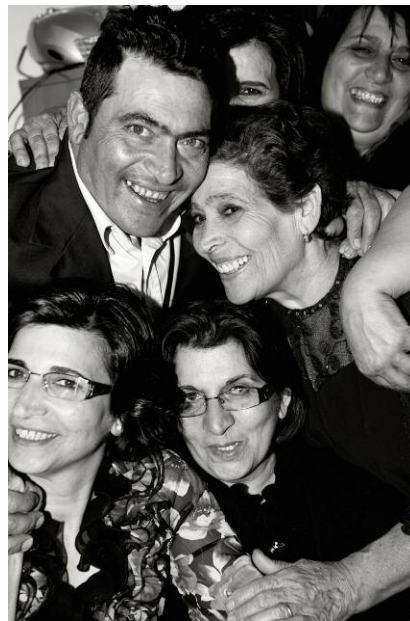
Pressebild 6