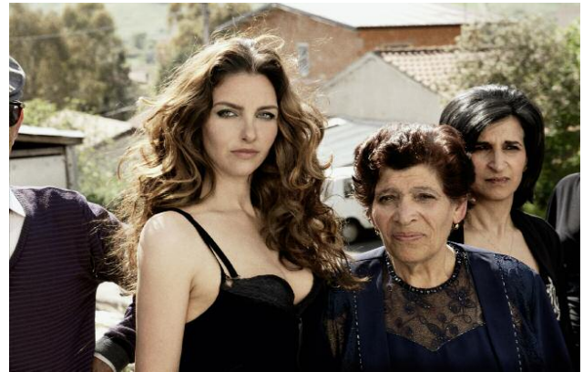
Pressebild 4