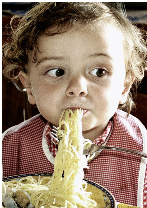
Pressebild 10