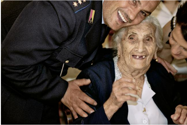
Pressebild 1