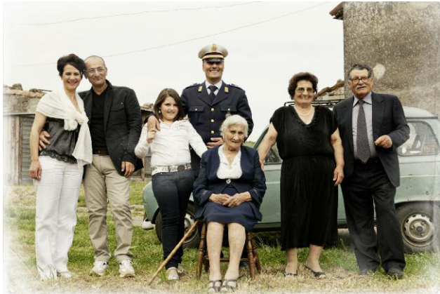
Pressebild 7