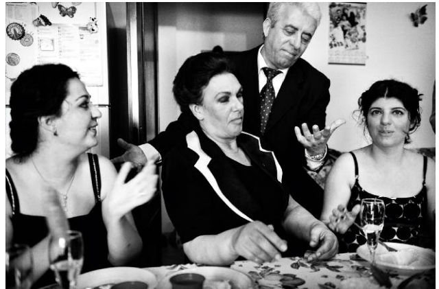
Pressebild 2