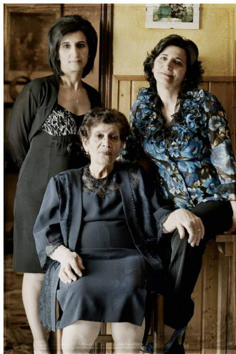
Pressebild 9