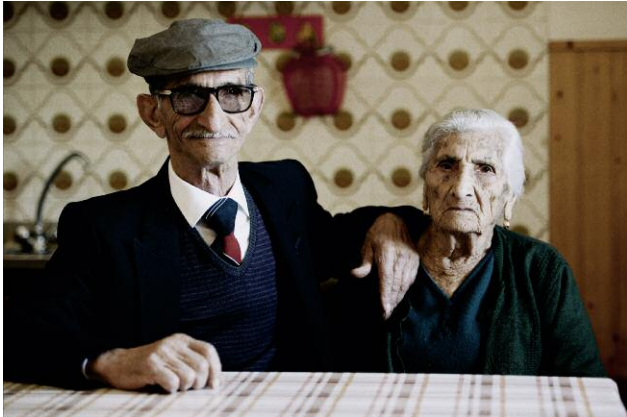
Pressebild 3