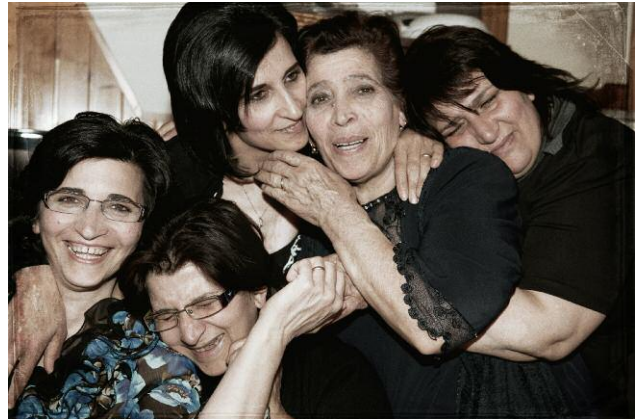
Pressebild 8 © HANSPETER SCHNEIDER