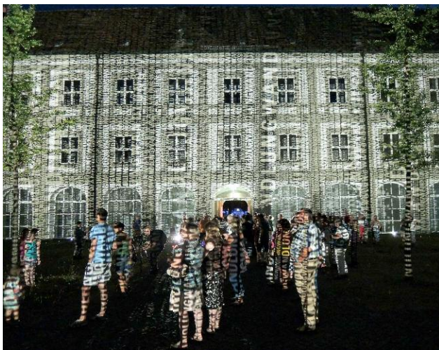
05_WANDLUNG, Innenhof des Klosters Fürstenfeld, Fürstenfeld leuchtet, Fürstenfeldbruck, 26. und 27. Juli 2013