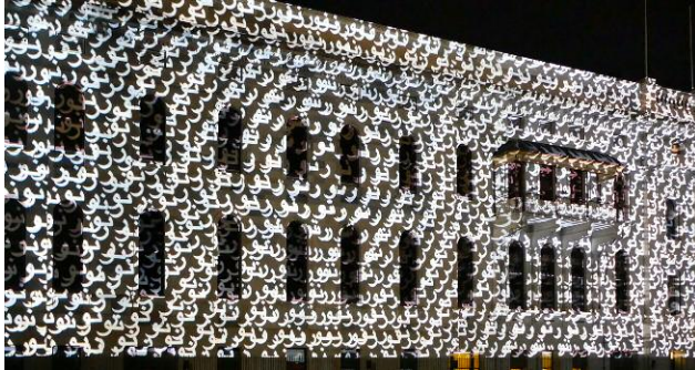
07_LIGHT, Parliament Building, Adelaide Festival, Blinc, Musik von Bradford Catler, kuratiert von Craig Morrison , Adelaide, Australien, 27. Februar bis 15. März 2015