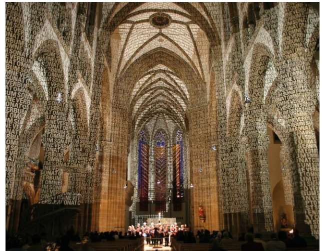
04_OMNE VERBUM SONAT, St. Paulskirche, Lange Nacht der Musik München, 27. Mai 2006 und 31. Mai 2008