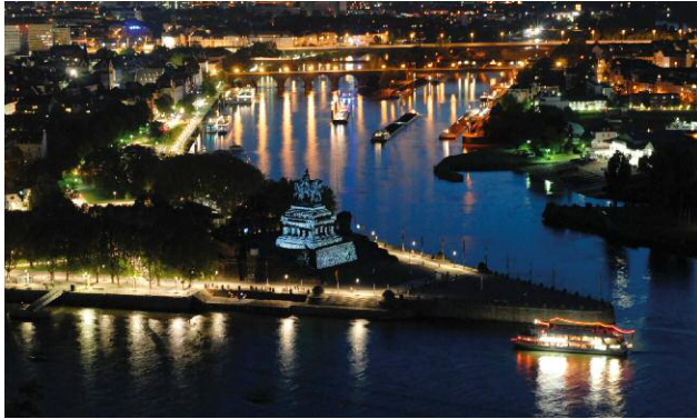
01_LEBENSZEICHEN, Kaiser Wilhelm I Denkmal, Deutsches Eck, LICHTSTRÖME 2012, Nachtprogramm der Bundesgartenschau, kuratiert von Bettina Pelz und Tom Groll, Koblenz, 11. bis 20. Mai 2012