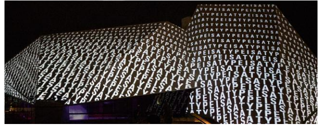
DOTS FOR ADELAIDE, Festival Center, Adelaide Festival, Blinc Musik von Zinkl, kuratiert von Craig Morrison Adelaide, Australien, 27. Februar bis 15. März 2015 ©Hartung Trenz