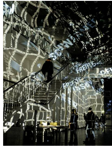
02_VOLIÈRE — EINE FREIFLUGANLAGE FÜR WORTE, neues kunstforum Köln, 6. bis 28. November 2010 ©Hartung Trenz