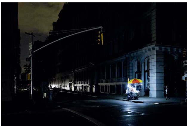
New York City, New York, USA