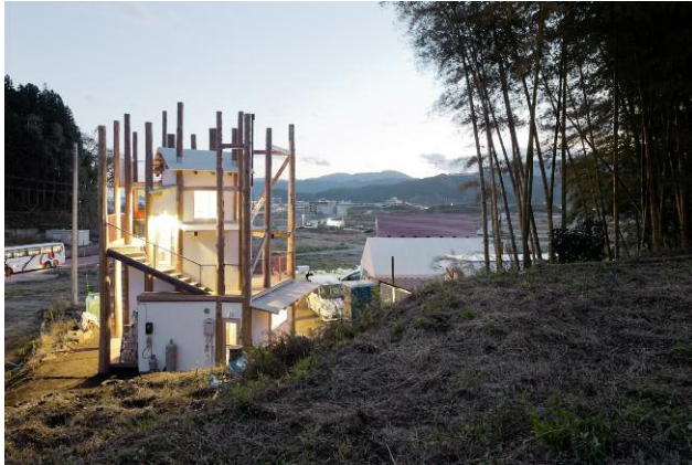
Rikuzentakata, Japan