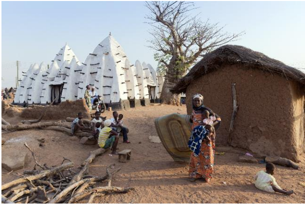
Larabanga, Northern Ghana