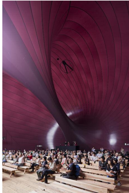
Matsushima, Japan