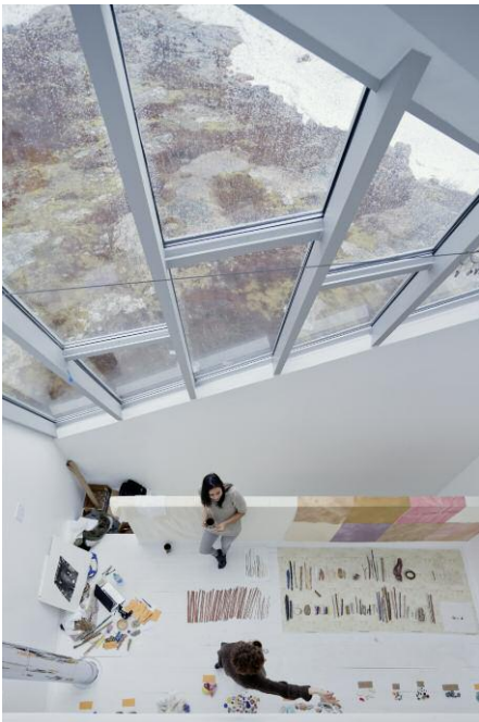
Fogo Island, Newfoundland, Canada