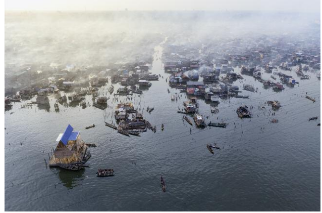
Makoko, Lagos, Nigeria