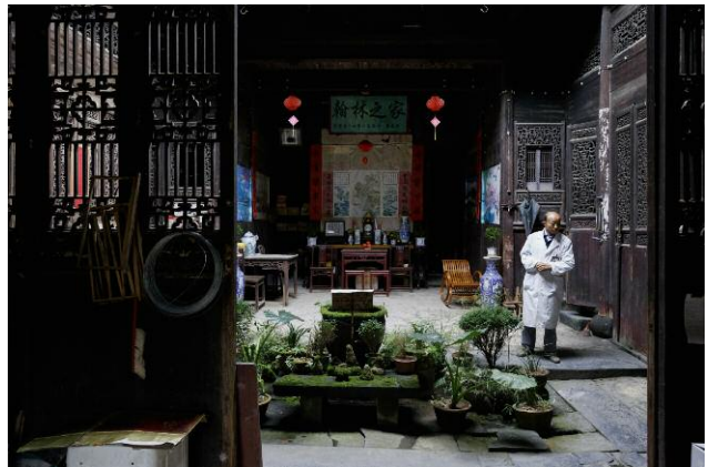
Nanping Village, Anhui Province, China