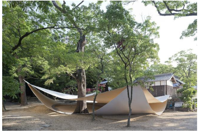
Shodoshima, Japan