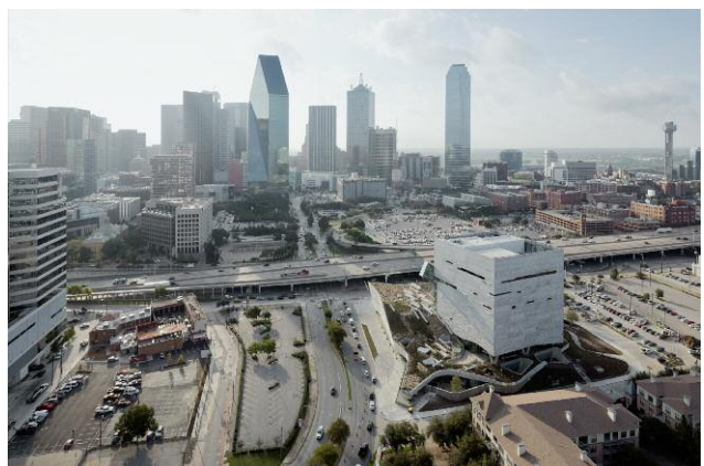
Dallas, Texas, USA