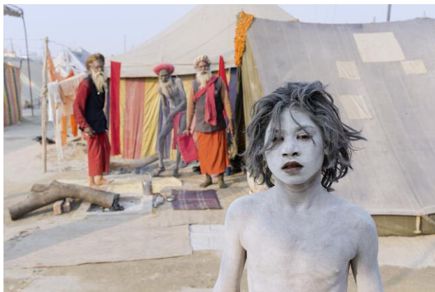
Allahabad, India