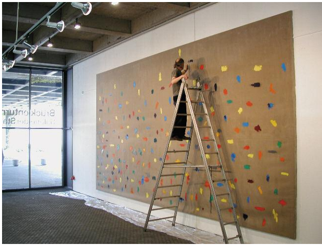
Jerry Zeniuk: 1 Bild (entsteht) im Brückenturm, Galerie der Stadt Mainz, 2001 Foto: Alf-Krister Job, Mainz © JERRY ZENIUK