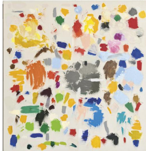
Untitled, No. 266, 2003 PRIVATSAMMLUNG