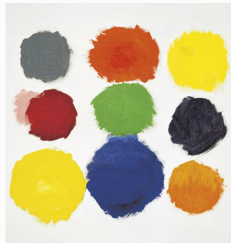
Untitled, No. 273, 2004