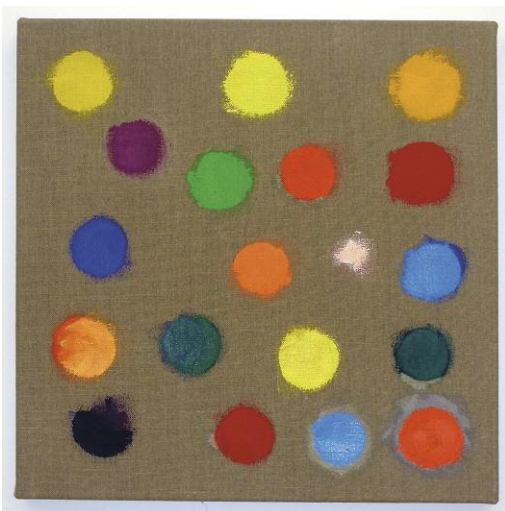
Untitled, 2010