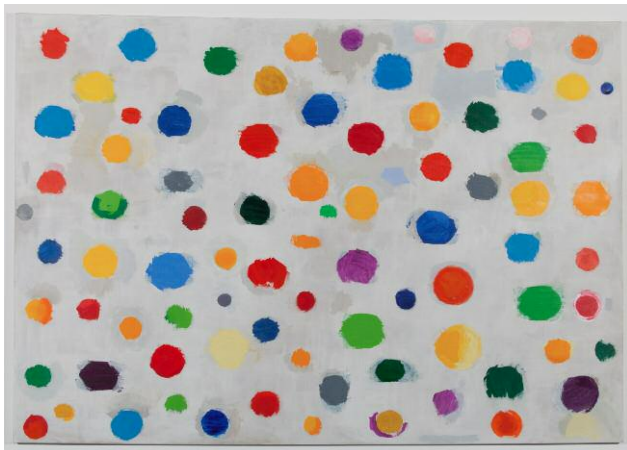
Altarbild II (The Army of God against Satan), 2007 © JERRY ZENIUK