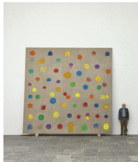
Botanischer Garten, 2013 Foto: Wolfgang Pulfer © JERRY ZENIUK