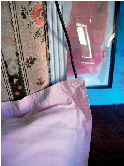
Shades of time

Was war, ist und für immer bleiben wird, ist der untrügliche Instinkt, mit dem Jessica Backhaus ihre Bildkompositionen behutsam zusammenführt und weiterentwickelt.