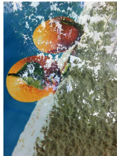
Lucky Strike © Jessica Backhaus