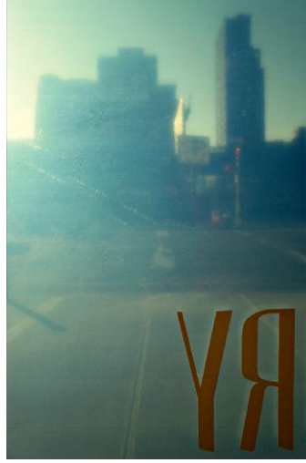
Sorry © Jessica Backhaus