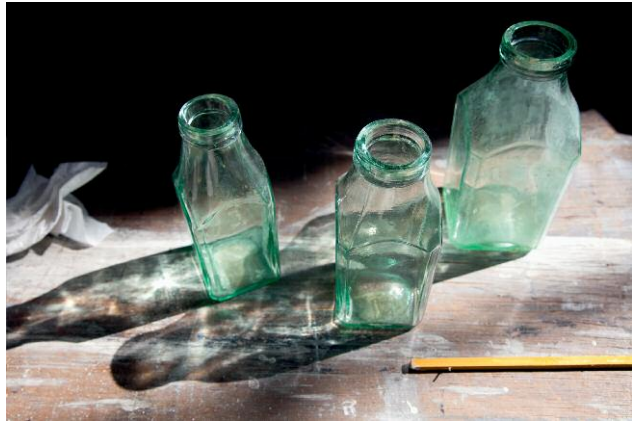
Memories in a bottle