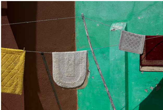
Journey © Jessica Backhaus