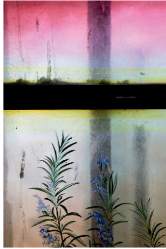
Timeless © Jessica Backhaus