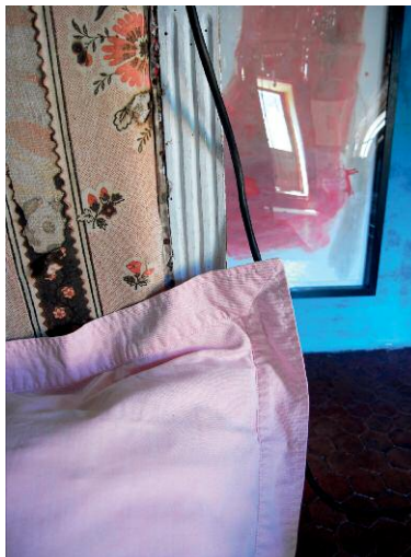
Shades of time © Jessica Backhaus