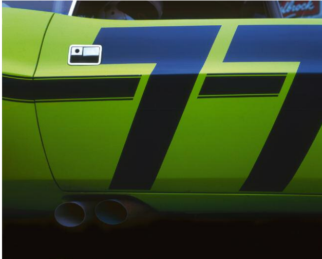
1 Challenger (#77), 2004 © 2013 JORY HULL, KEHRER VERLAG HEIDELBERG BERLIN