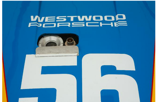
8 Porsche (#56), 2009