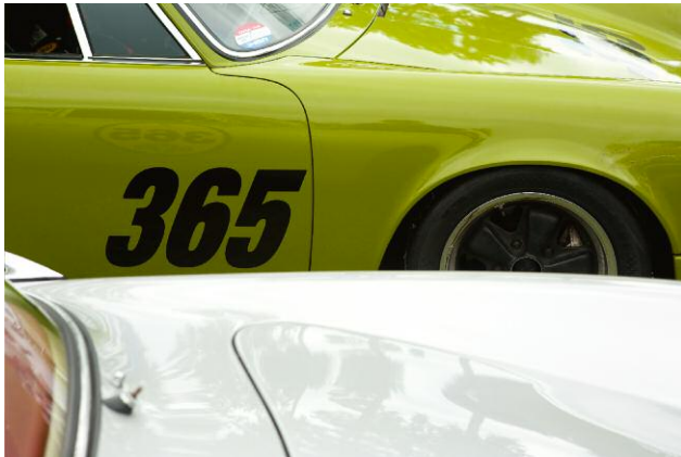
7 Porsches, 2009