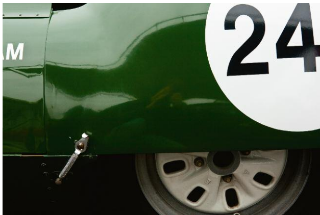
3 Lotus (#24), 2009 © 2013 JORY HULL, KEHRER VERLAG HEIDELBERG BERLIN