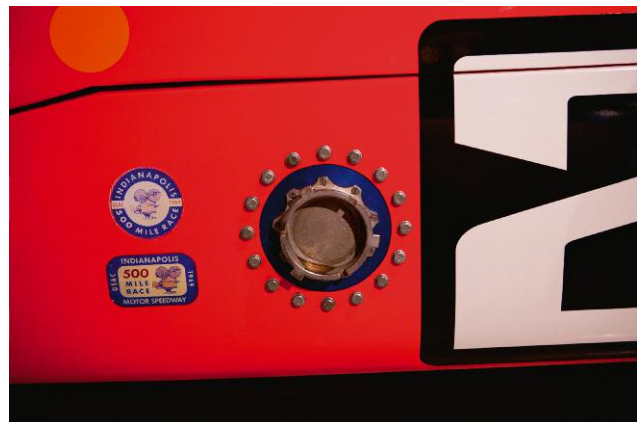
4 Fuel Filler, 2010