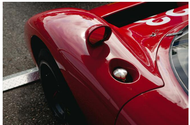
6 Bonnet (Chevron), 2009 © 2013 JORY HULL, KEHRER VERLAG HEIDELBERG BERLIN