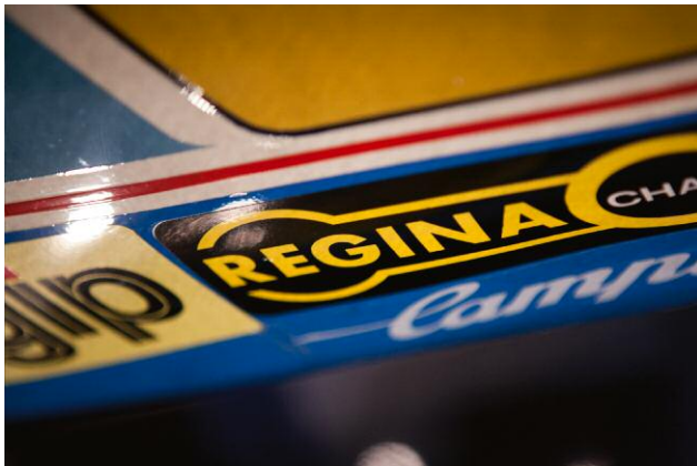
9 Untitled (Suzuki), 2010