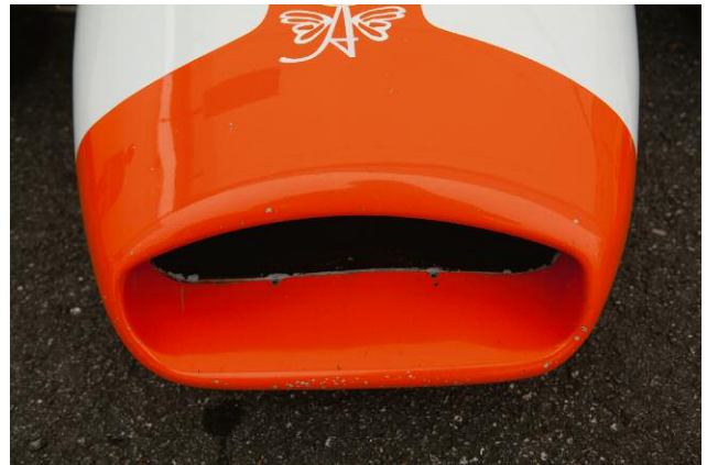
2 Nosecone, 2009 © 2013 JORY HULL, KEHRER VERLAG HEIDELBERG BERLIN