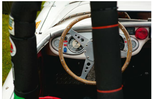
10 Austin Healey, 2009