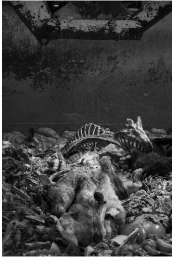
01 © K49814