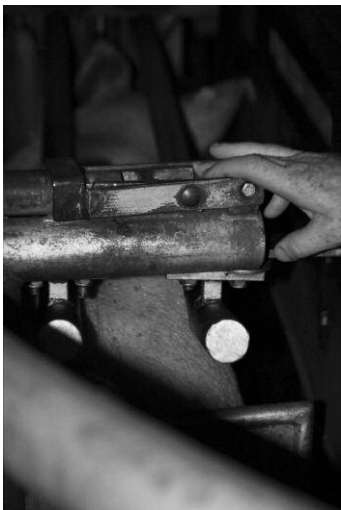
03 © K49814