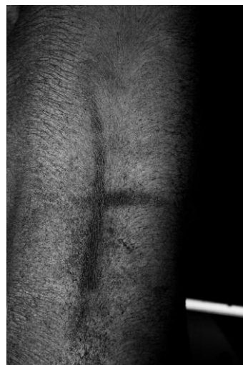
06 © K49814