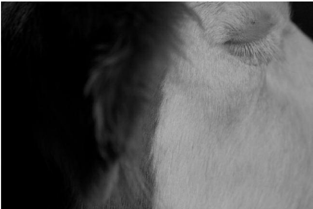
09 © K49814