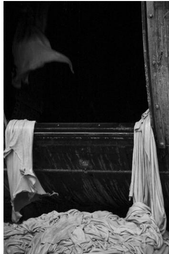
02 © K49814