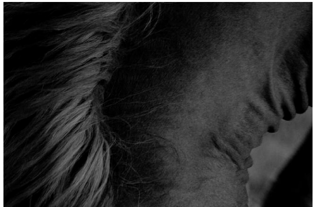
04 © K49814