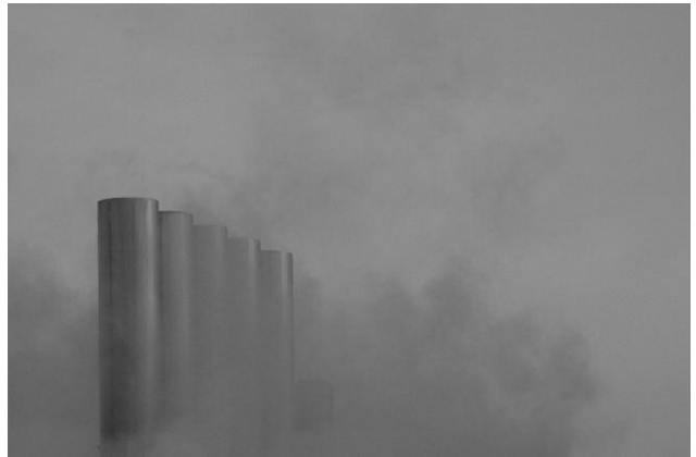
10 © K49814