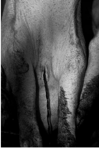
07 © K49814