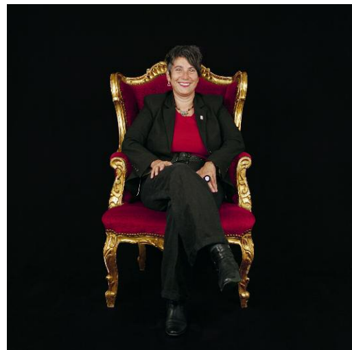
10 - Monika Hauser, Trägerin des Right Livelihood Award 2008, Deutschland