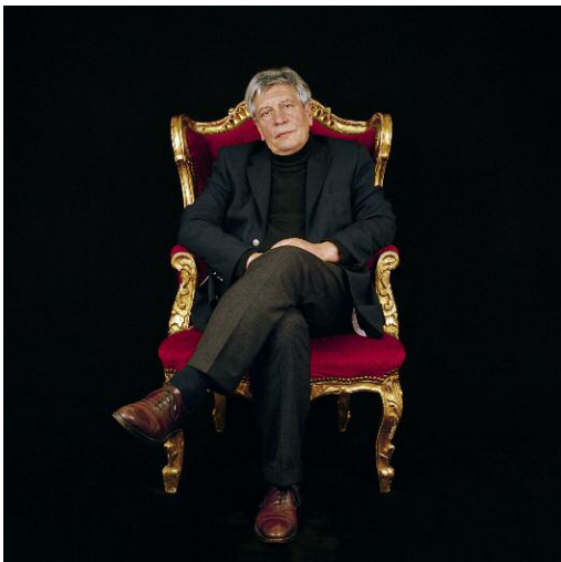
3 - Hermann Scheer, Träger des Right Livelihood Award 1999, Deutschland