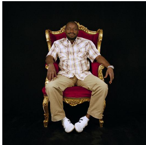
2 - Guillaume Harushimana, Träger des Right Livelihood Award 2002, Burundi