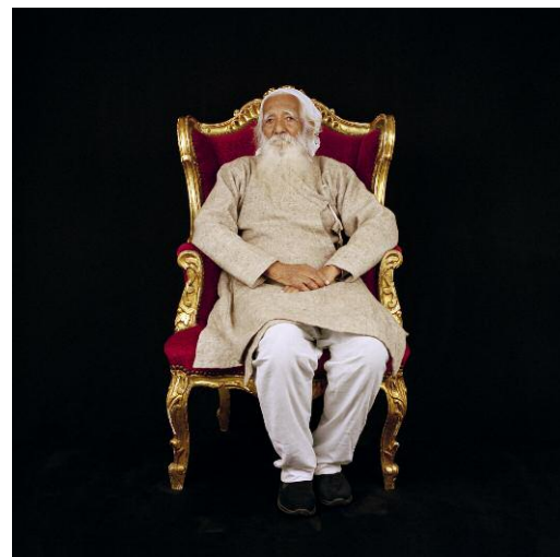
12 - Sunderlal Bahuguna, Träger des Right Livelihood Award 1987, Indien