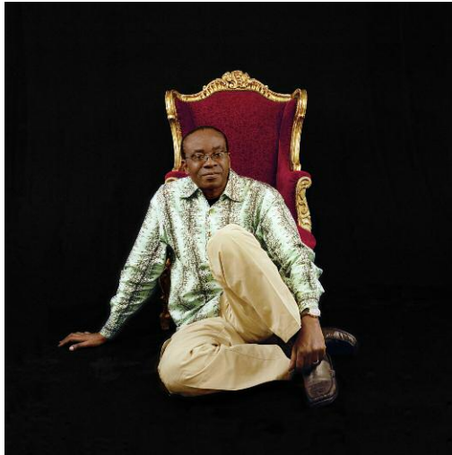
15 - Nnimmo Bassey, Träger des Right Livelihood Award 2010, Nigeria