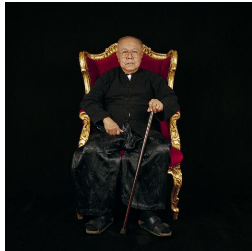
14 - Sulak Sivaraksa, Träger des Right Livelihood Award 1995, Thailand