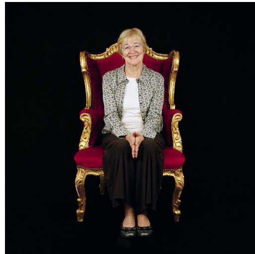
8 - Maude Barlow, Trägerin des Right Livelihood Award 2005, Kanada