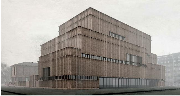
Pressebild 7 © Max Dudler, Berlin, Deutschland