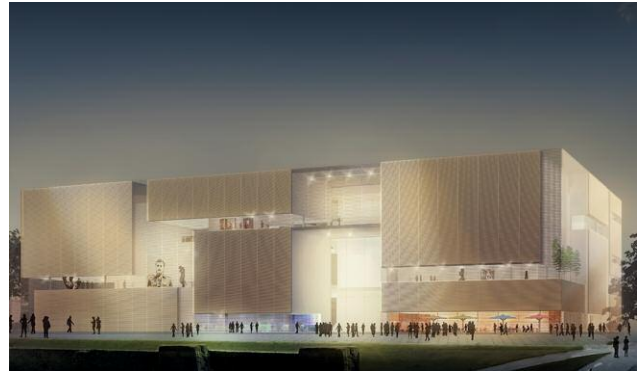
Pressebild 2 © Gerkan, Marg und Partner