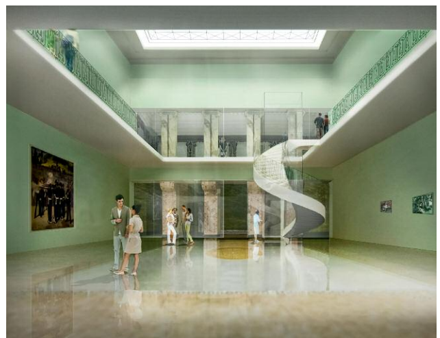
Pressebild 6: Innenansicht © Sanaa, Tokio, Japan