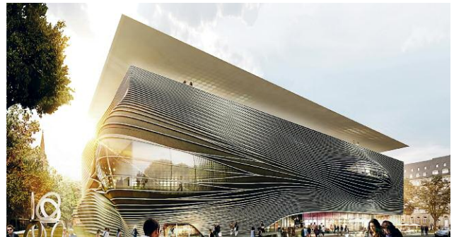
Pressebild 8 © Zaha Hadid Architects, London, Großbritannien