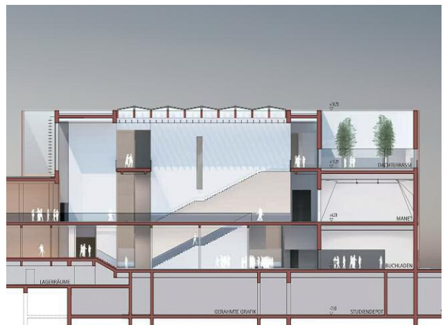
Pressebild 4: Schnitt © Gerkan, Marg und Partner