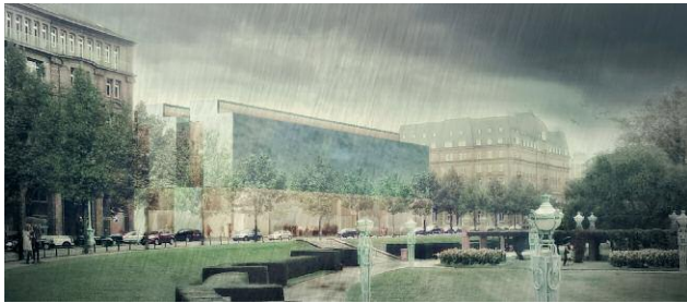
Pressebild 9 © Peter Pütz Architekt, Berlin, Deutschland