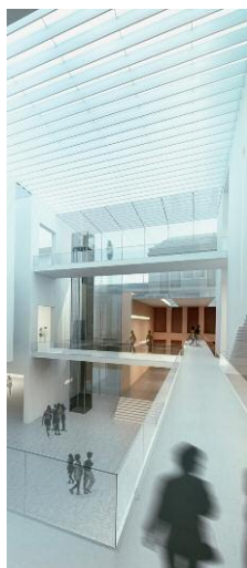
Pressebild 5 © Gerkan, Marg und Partner