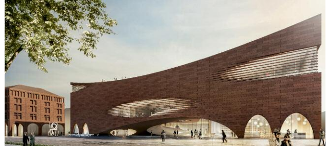
Pressebild 10 © WPS Architekten, Schwäbisch Gmünd, Deutschland