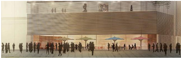
Pressebild 1 © Gerkan, Marg und Partner, Hamburg, Deutschland