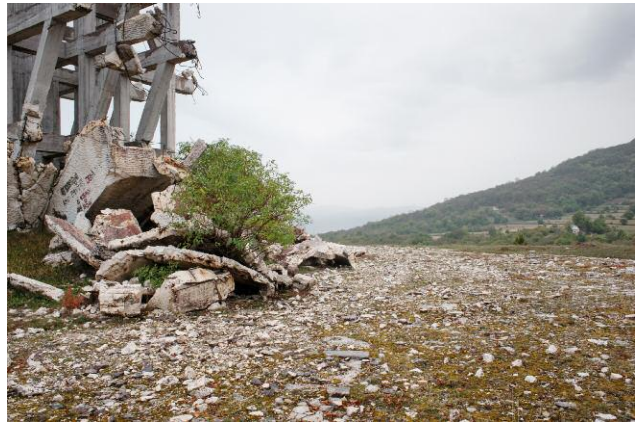
08_ After the last conflict, the Bosnian Croats renamed Prozor and called it Rama, after a nearby site known for the ruins of its Roman Churches. Today Prozor-Rama is a divided city between Bosnian Croats and Bosnian Muslims. In 2000 the memorial was blown up.