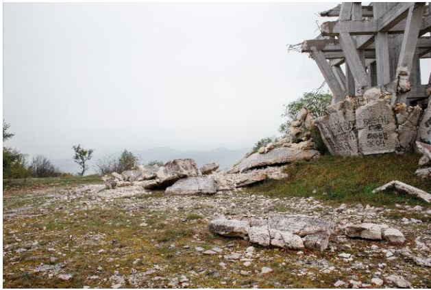
07_ The memorial on Mount Makljen in the municipality of Prozor-Rama was designed by the artist Boško Kučanski and realized in 1978. It commemorates the so called Battle of Wounded (1943, Second War World), when the partisan antifascist resistance prevented the German troops from reaching the hospital of Prozor.