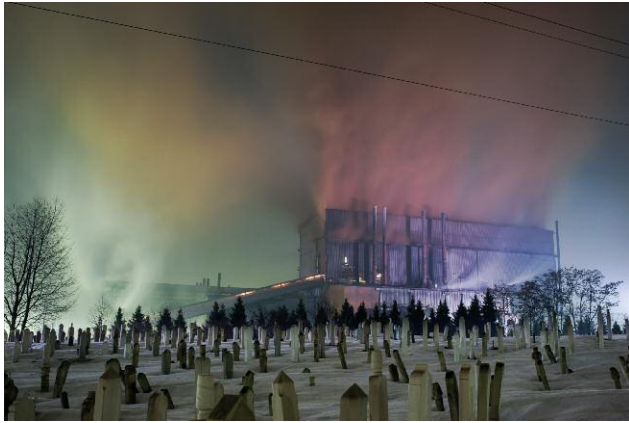
01_Before WWII, Zenica was a small town with a small-scale steel mill built during the Austro-Hungarian Empire. Thanks to the new infrastructures such as the Šamac-Sarajevo railroad and the modernisation of the steel factory, Zenica attracted many people from all over Yugoslavia and became one of the largest cities in Bosnia and Herzegovina.