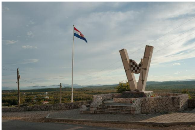
03_Memorial site in Buhovo, in Herzegovina, reminds the local Bosnian Croat victims of the last conflict.