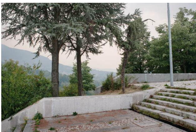
05_Located on the mountains surrounding Sarajevo, Vrca Memorial Park commemorates more than eleven thousand Sarajevans who died during the Second World War, regardless their nationality. It was inaugurated on the 25th of November 1981, to celebrate the National Day of BiH.