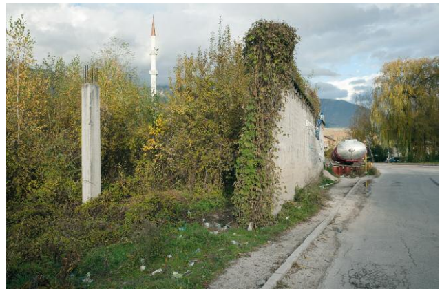
04_New mosque Malezija in the centre of Turbe, a small town near Travnik, in central Bosnia.