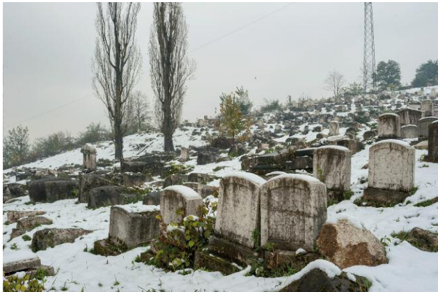
09_ For half a millennium, Jews, Catholics, Orthodoxies and Muslims lived together in the multicultural city of Sarajevo. The siege of Sarajevo started in the year of the 500th anniversary of the exile of Sephardic Jews from Spain. Around twenty days after the celebration, most of the Jews left the city, towards a new exile.