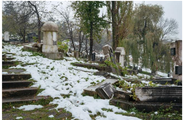
10_ The Sarajevo Jewish Sephardic cemetery is one of the biggest in Europe. During the war, it was the front line between BiH Army and Bosnian Serb Army. It was severely damaged and heavily mined by Bosnian Serbs.