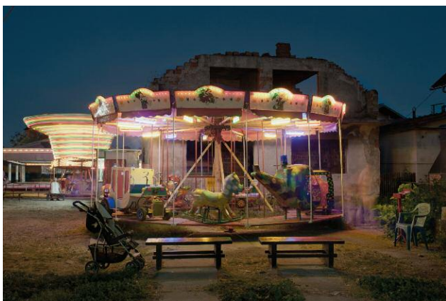
11_ Kozarac, the town at the foot of Mount Kozara, well-known place in former Yugoslavia for its partisan resistance during the Second World War, was ethnically cleansed and destroyed by Serb forces during the last conflict. Survivals became part of the Bosnian Diaspora around the world.