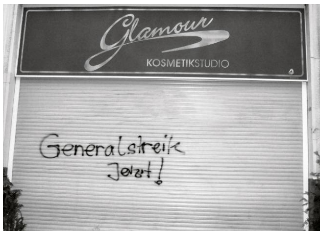
05_Laughing Inverts ©Lena Rosa Händle