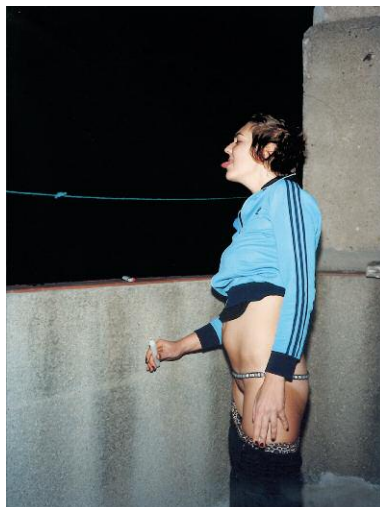
10_Laughing Inverts