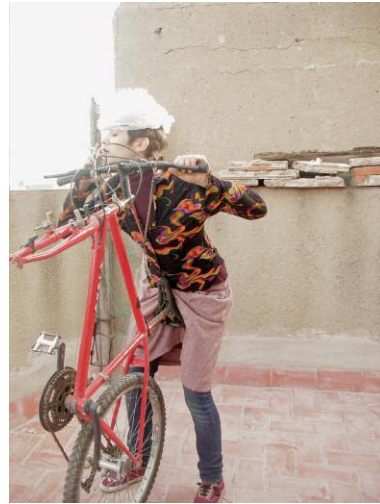
08_Laughing Inverts ©Lena Rosa Händle