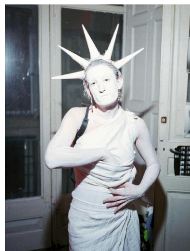
06_Laughing Inverts