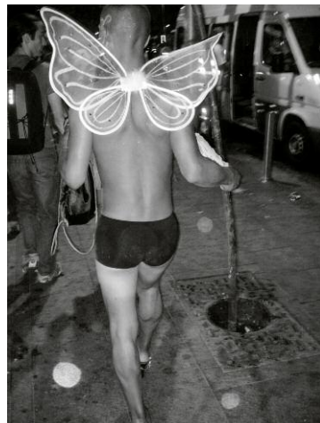
12_Laughing Inverts