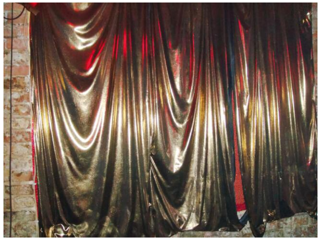
02_Laughing Inverts ©Lena Rosa Händle