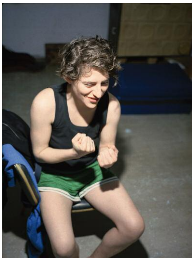
03_Laughing Inverts