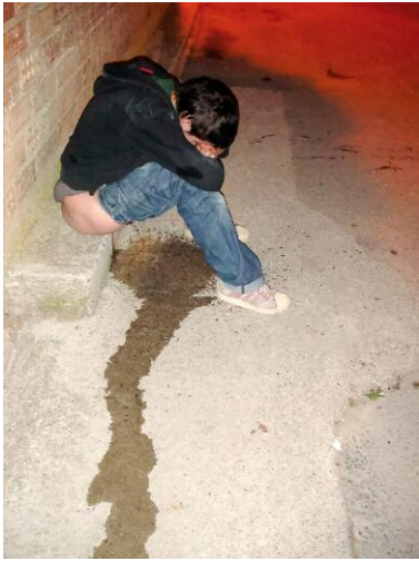
07_Laughing Inverts ©Lena Rosa Händle