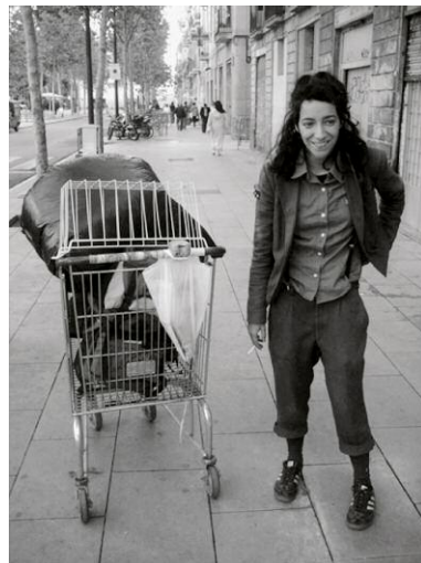
04_Laughing Inverts