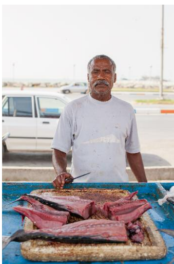
05_Zaker / Fish market, Bandar Abbas