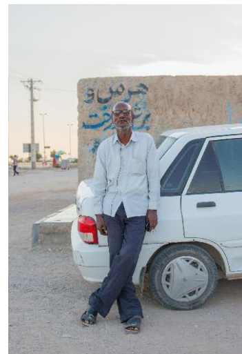
06_Eshagh / Khaje-Ata, Bandar Abbas