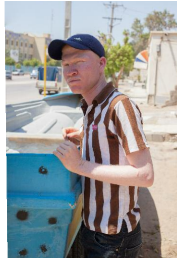
02_Haji / Khaje-Ata, Bandar Abbas