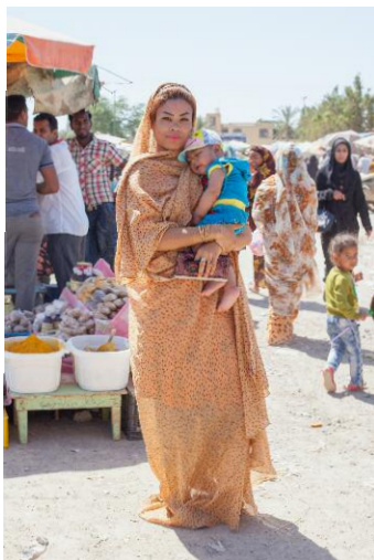
03_Sanaz / Thursday market, Minab