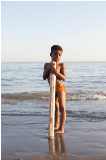
01_Mohammad Ali / Khaje-Ata, Bandar Abbas © Mahdi Ehsaei