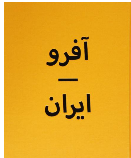
12_Buch Afro-Iran, Umschlag Rückseite