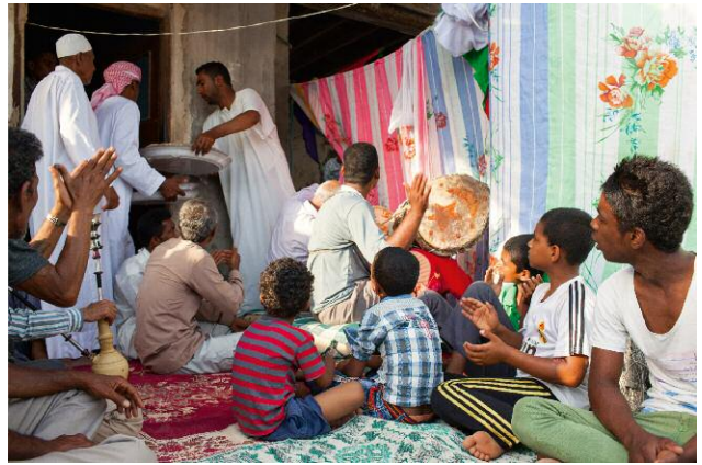
08_Zar ceremony, Tiab