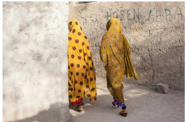
04_Khaje-Ata, Bandar Abbas