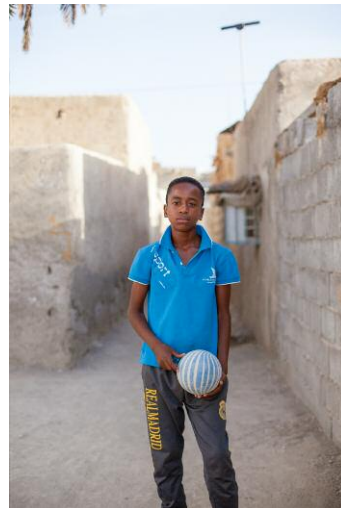
10_Mahdi / Khaje-Ata, Bandar Abbas