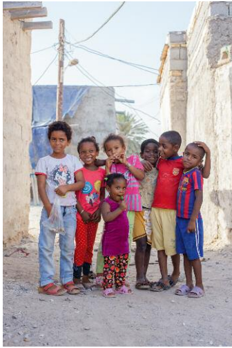
07_Khaje-Ata, Bandar Abbas