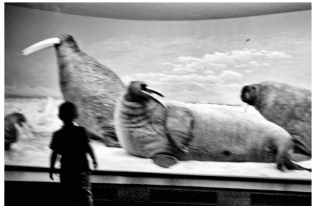
12_Untitled © MATHIAS CHRISTENSEN