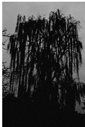
06_Untitled © MATHIAS CHRISTENSEN