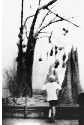
08_Untitled © MATHIAS CHRISTENSEN