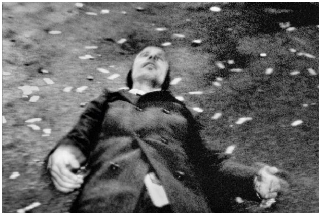
09_Untitled © MATHIAS CHRISTENSEN