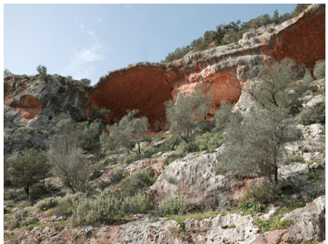
6 Tree line above blown German bridge, Wadi al Kouf, Libya