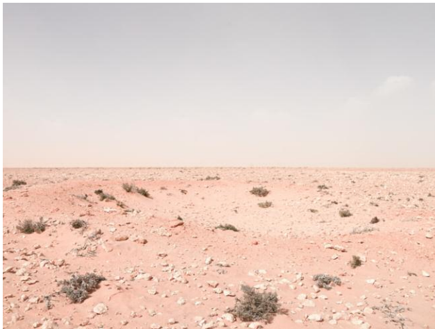
1 Artillery position in approaching sandstorm, Alem Hamza Battlefield, Libya