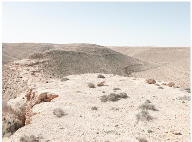
12 Artillery emplacement, Bunker Z84, Wadi Zitoune Battlefield, Tobruk perimeter, Libya