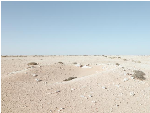
3 Artillery position, Bir Hacheim Battlefield, Libya