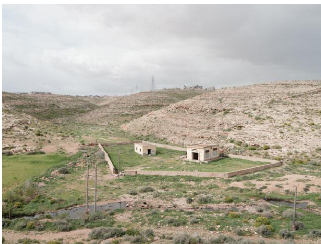
5 Wadi Auda Water Pumping Station below Fort Auda, Libya