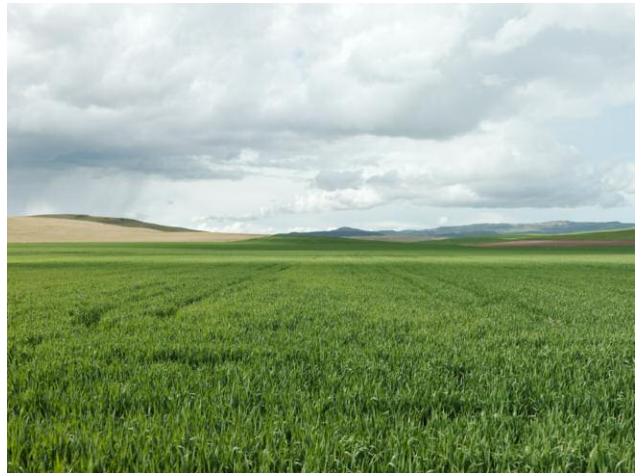
10 Rain, Medjez El Bab Battlefield, Tunisia