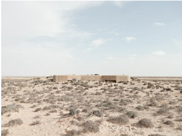
9 Bunker, Mareth Line, Tunisia