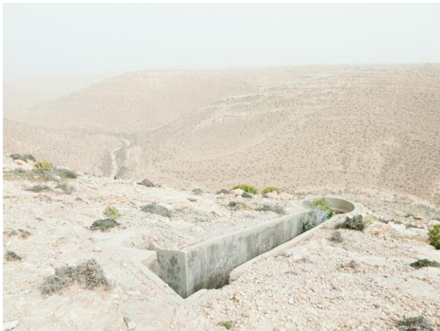
11 Gun emplacement, Bunker Z93, after a sandstorm, Wadi Zitoune Battlefield, Tobruk perimeter, Libya