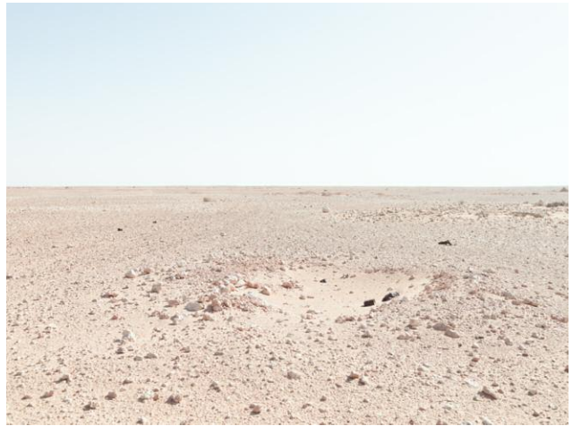
2 Infantry positions, Bir Hacheim Battlefield, Libya