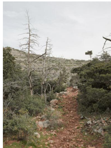
4 Goat track used by British Commandos in the raid on Rommel's headquarters near Al Bayda, Libya