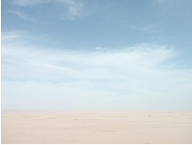
7 Chotte El Jerid after a sandstorm, Tunisia