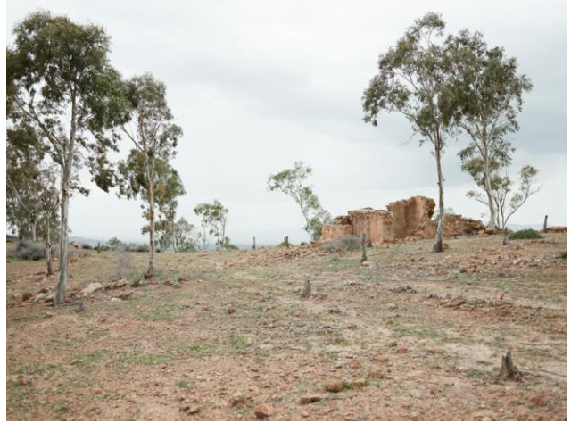
8 Shelled building atop Djebel Bou Aoukaz, Tunisia