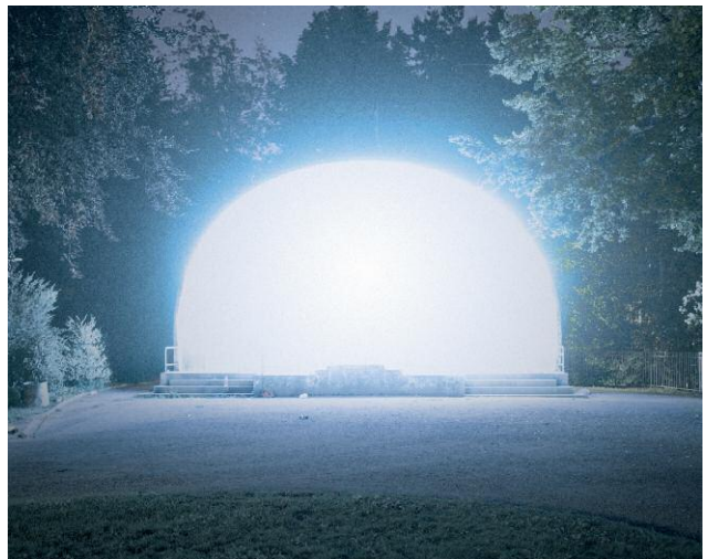
10_Flash II