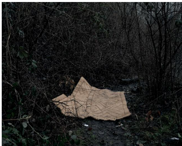
05_Injection I © Matthieu Gafsou