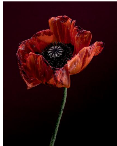
04_Papaver Somniferum