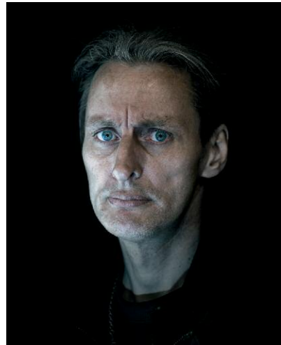
08_Armando © Matthieu Gafsou