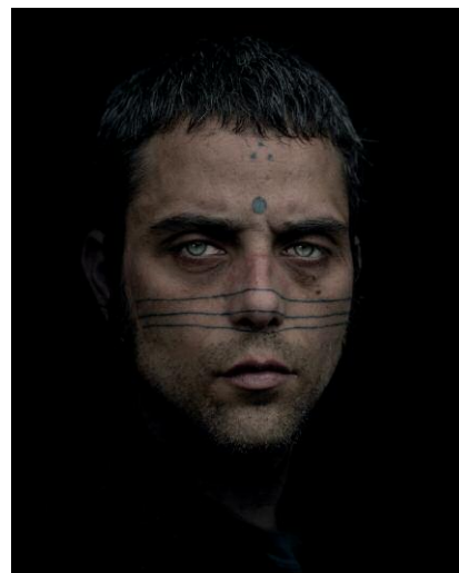
06_Daniel © Matthieu Gafsou