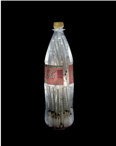
07_Coke/Coca © Matthieu Gafsou