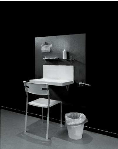
09_Injection II