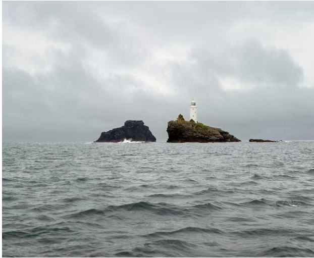
1 © Michael Marten