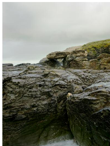
8 © Michael Marten