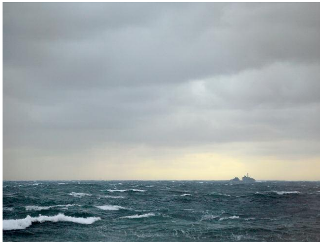
3 © Michael Marten