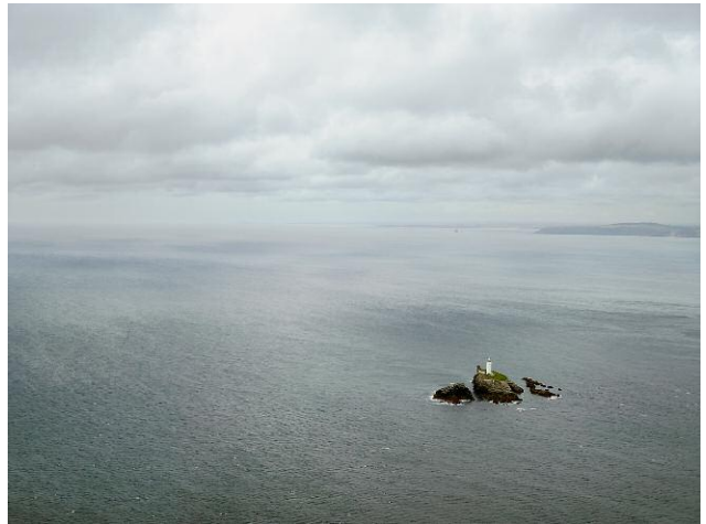
4 © Michael Marten