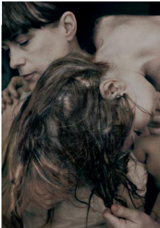
1. © Monika Macdonald