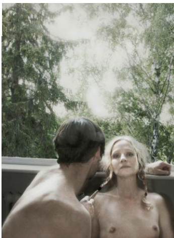
5. © Monika Macdonald