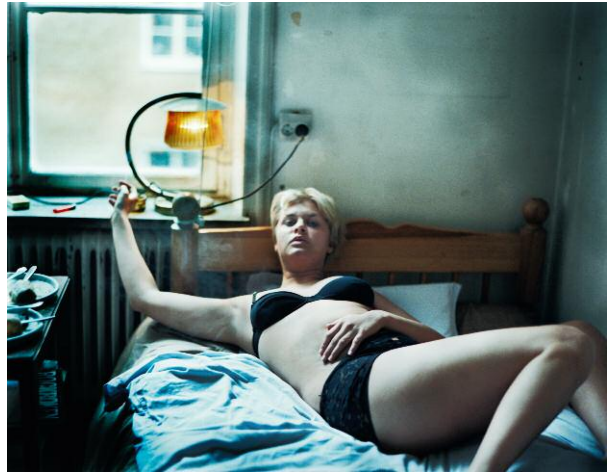
8. © Monika Macdonald