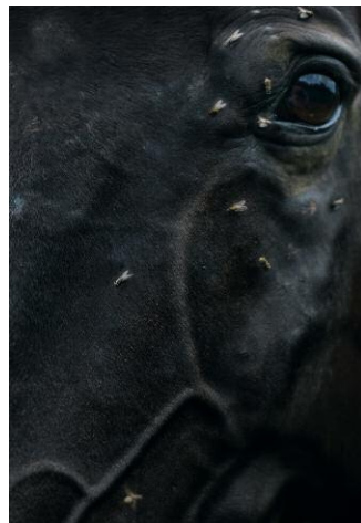
10. © Monika Macdonald