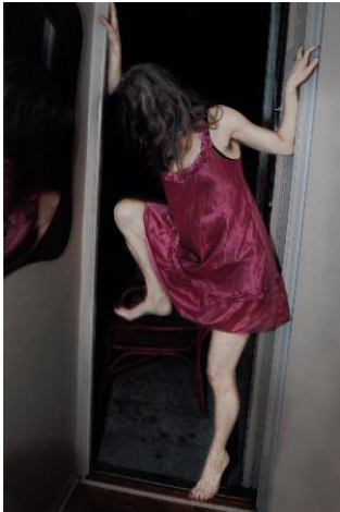
7. © Monika Macdonald