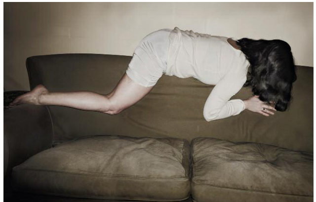
2. © Monika Macdonald