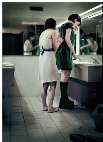
6. © Monika Macdonald