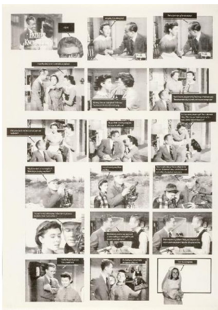
5 Father Knows Best English and Turkish silkscreen print, 50 x 70 cm, 2011 © Nancy Atakan