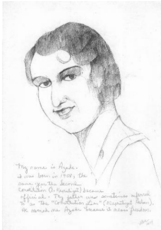
1 My Name is Azade (Freedom) 23 pencil drawings with handwritten texts on paper, 30 x 40 cm, 2014 © Nancy Atakan