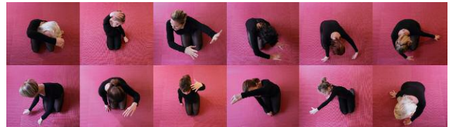
4 Passing On II Double-channel video, 4'12", 2015 © Nancy Atakan