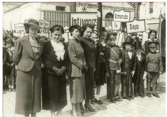
6 Still Waiting, C-print, 200 x 300 cm, 2012 © Nancy Atakan