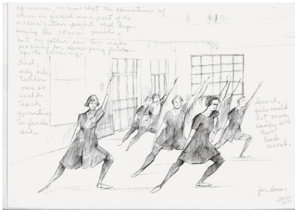
3 My Name is Azade (Freedom) 23 pencil drawings with handwritten texts on paper, 30 x 40 cm, 2014 © Nancy Atakan