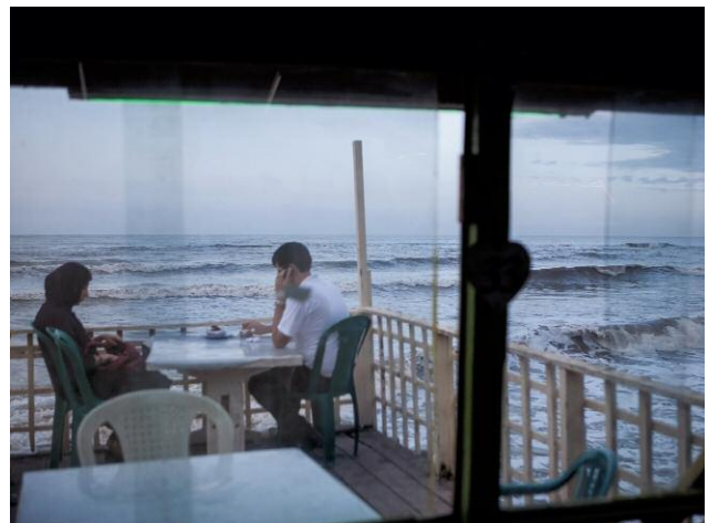
10. A couple sitting by the sea.