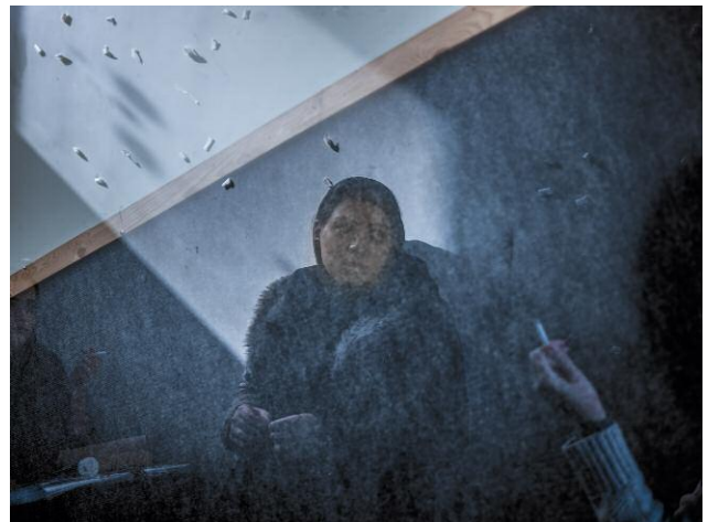
4. Girls smoking in a hallway of the university during a break.