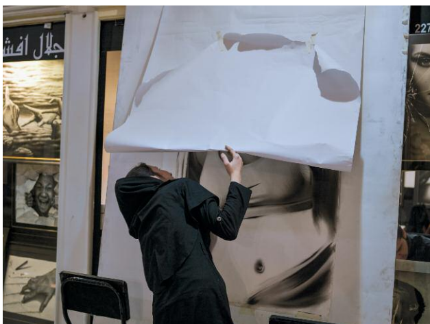
5. A young woman tries to sneak a peek of a drawing of a woman covered by white paper in Qaem Mall, under Iran's Islamic laws showing women's bodies in public is forbidden.