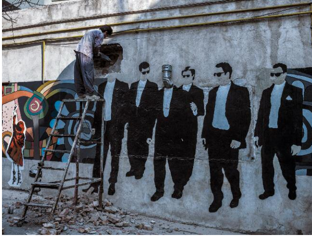
7. A worker drilling into the wall to fix a vent on the campus of Tehran University of Art.