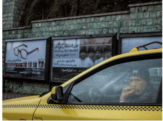
8. A taxi driver in his car on a rainy day. Behind him a poster of an upcoming performance of Samuel Beckett's play "Waiting for Godot".