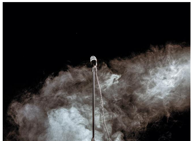
6. A view of a microphone and an empty stage in Tehran.