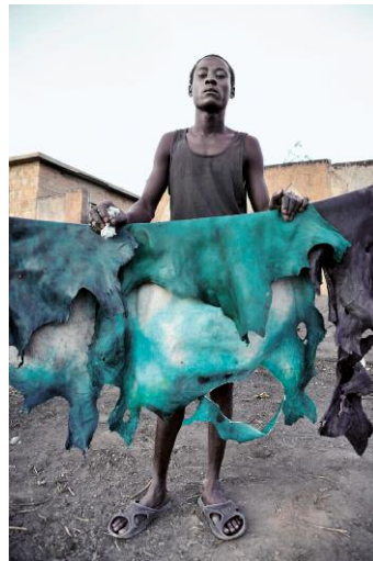
8 - Assada / Tannery / Niamey