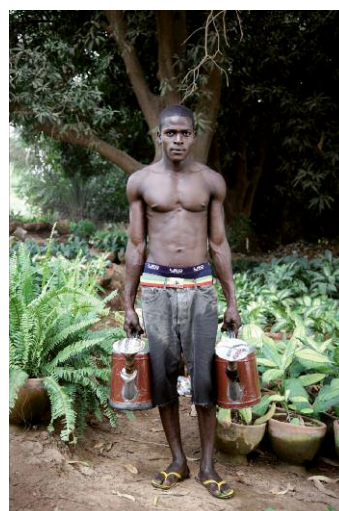
6 - Azize / Vegetable Gardens / Niamey