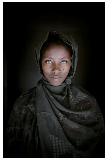
12 - Ominta / Barn / Téra