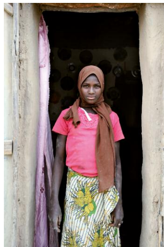
4 - Cabin © Nicola Lo Calzo