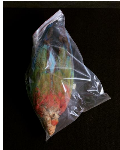
2. Headless, embalmed parrot. According to Maroon tradition, forest animals are associated with Komanti, Diadja & Opete divinities. Alexandre Franconie departmental Museum, Cayenne, French Guiana.