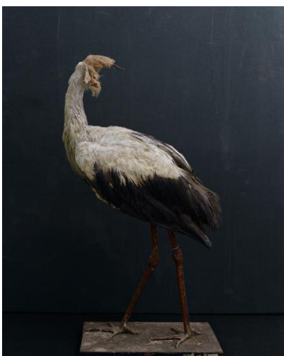
5. Headless, embalmed stork. Alexandre Franconie Museum, Cayenne, French Guiana.