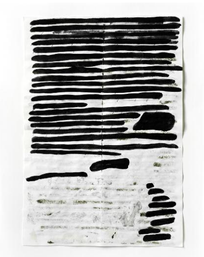
aus der Serie The Red Letter (and Other Confessions) ©NIINA VATANEN