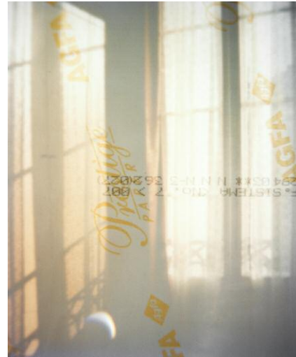
Reverse View, aus der Serie A Room's Memory