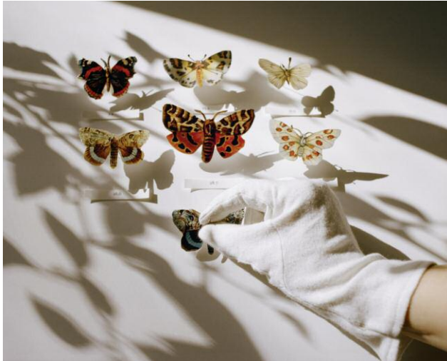
Collector, aus der Serie A Room's Memory