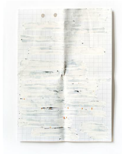
aus der Serie The Red Letter (and Other Confessions)