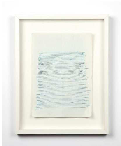
aus der Serie A Seamstress's Notes