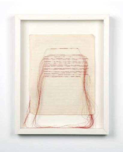
aus der Serie A Seamstress's Notes