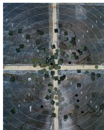
Hits, aus der Serie Grey Diary