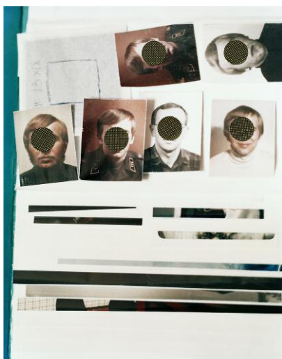
Album, aus der Serie Grey Diary