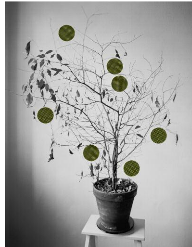
29 Days, aus der Serie Grey Diary