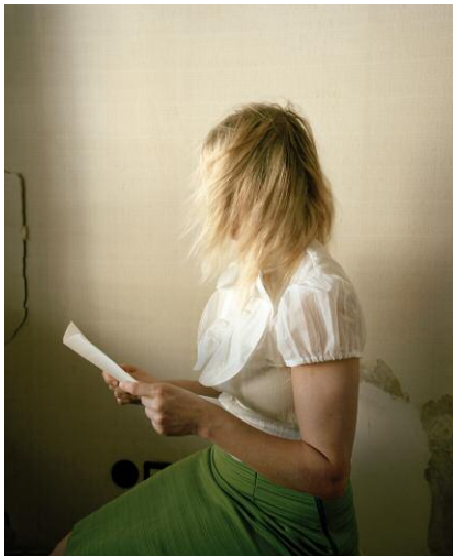
Untitled (Reader), aus der Serie A Room's Memory