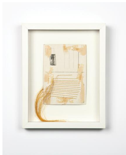
aus der Serie A Seamstress's Notes