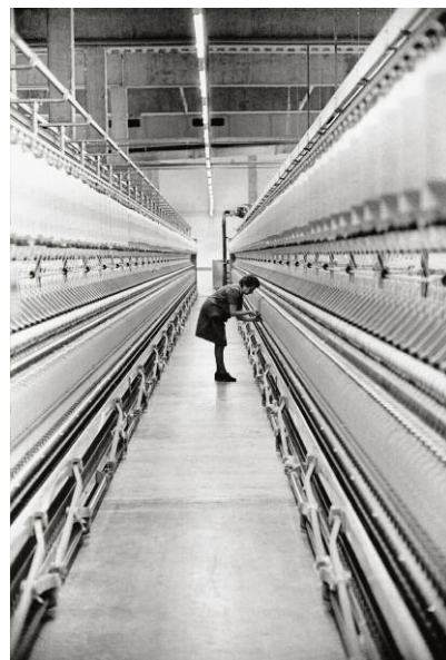
12 Textilspinnerei, Matri am Brenner, 1983 © NIKOLAUS WALTER