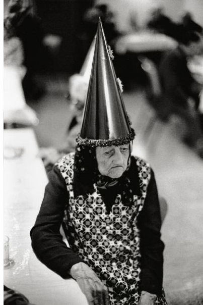
14 Fasching im Altersheim, Bregenz, 1979