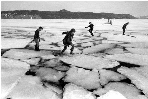
3 Cox's Cove, Neufundland, 1971