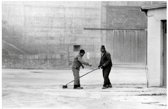
4 Zementwerk, Lorüns, 1983