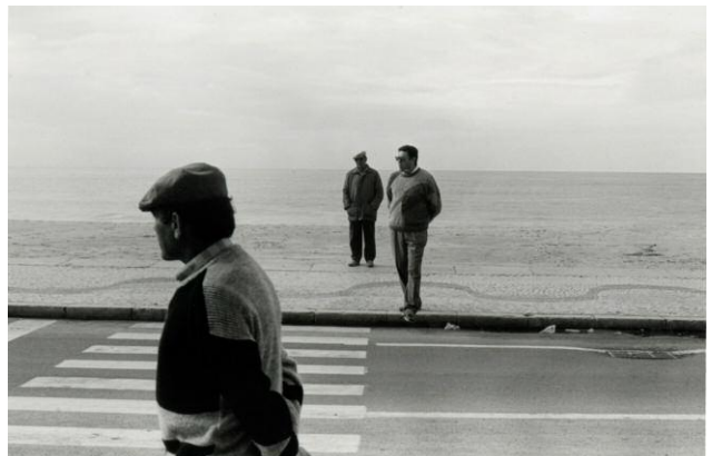
6 An einem Sonntag in Nazaré, Portugal, 1988