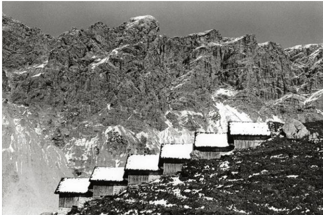
7 Spitzzegga, Klesenza, Großes Walsertal, 1978 © NIKOLAUS WALTER