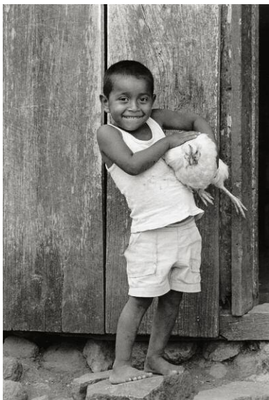
9 San Dionisio, Nicaragua, 1986