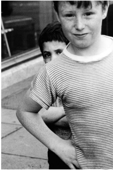
1 Straßenkinder, Dublin, 1967