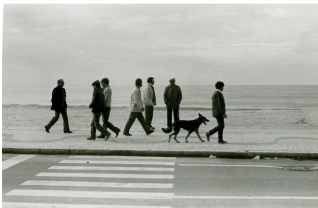
5 An einem Sonntag in Nazaré, Portugal, 1988