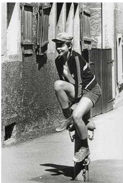
11 Der Hydrantenhocker, Hohenems, 1982