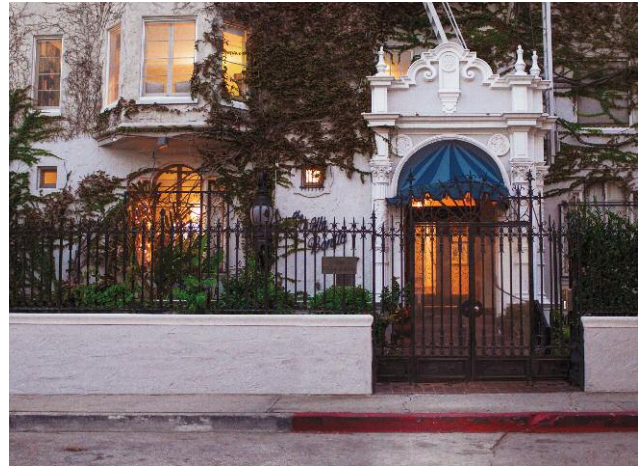
2 Villa Bonita