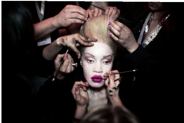
3. African-American model Diandra Forrest has her make-up and hair done before a show during the South Africa Fashion Week, Johannesburg 2012