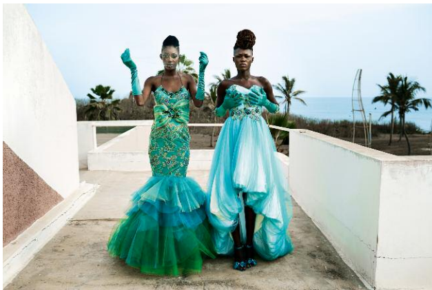
11. Models fit dresses for the Paris-based Cameroonian designer label Martial Tapolo Couture before a show in the Hôtel des Almadies during the Dakar Fashion Week, Senegal 2014