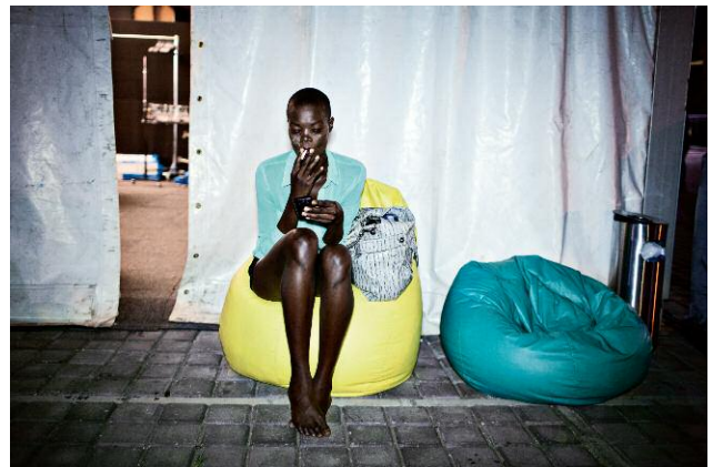
12. Sudan-born Canadian model Aluad Anei smokes a cigarette backstage during a break between shows during the Fashion Week Joburg on Fitzgerald Square in Newtown, Johannesburg 2013