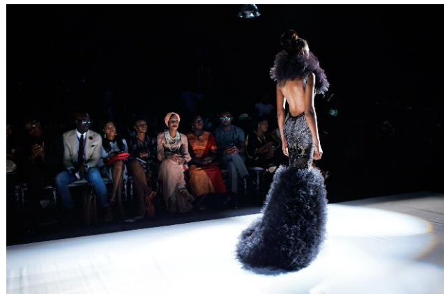
4. Front row guests watch a show during the Lagos Fashion & Design Week, Nigeria 2013