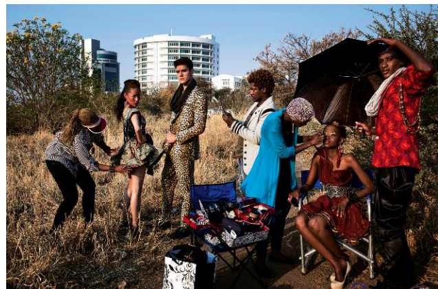
6. The Fashion label Black Trash, one of Botswana's leading designers, shoots on location with models and make-up artists a few days before the Color in the Desert Fashion Week in the Phakalane Golf Estate in Gaborone, Botswana 2012