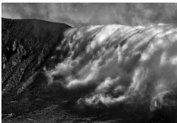
11 - Reventón, 2011 © Peter Schlör