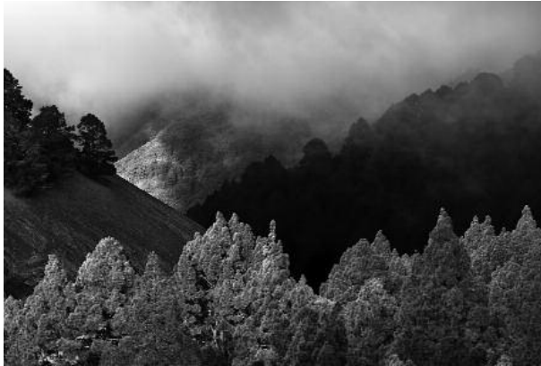
7 - Lomo de la Pileta, 2011