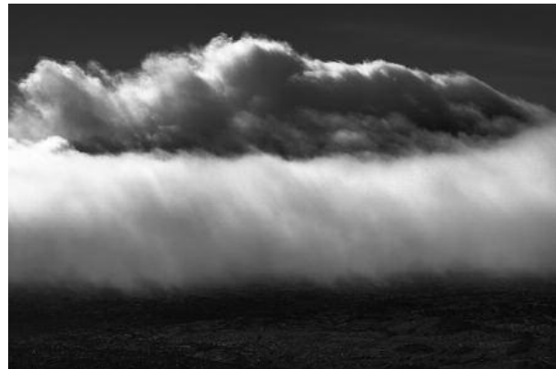
4 - Las Canadas, 2009