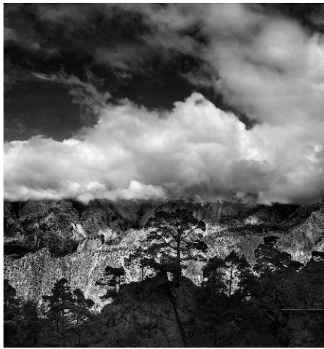
1 - Caldera de Taburiente, 2008