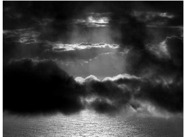
8 - Magana, 2010