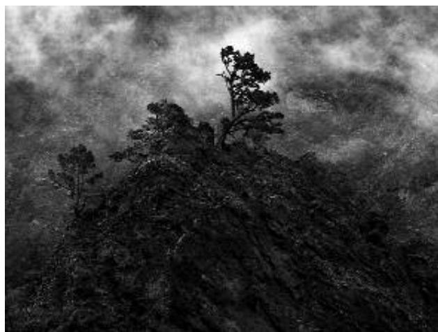
5 - El Pino, 2010 © Peter Schlör