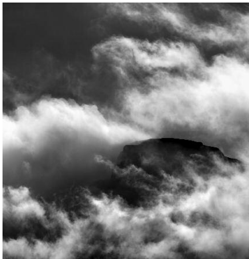
9 - Montaña de la Cruz, 2009 © Peter Schlör