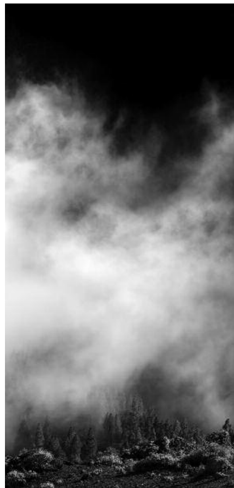
10 - Pedro Gil, 2009