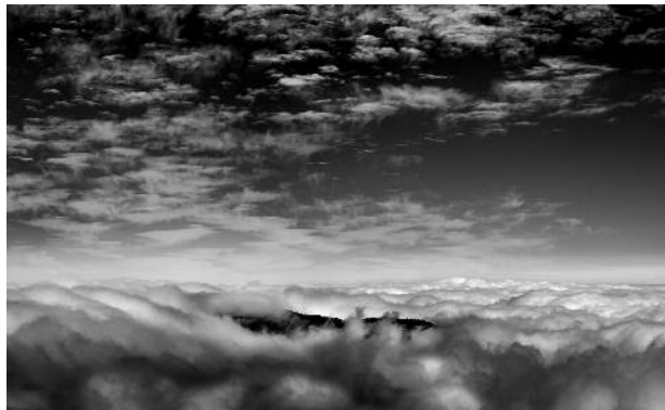
3 - Chimague, 2009