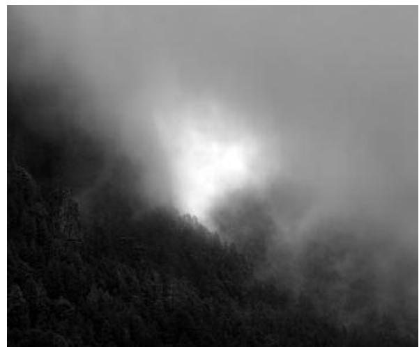
6 - Las Laderas, 2010 © Peter Schlör