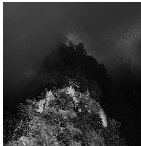
2 - El Barrial, 2011