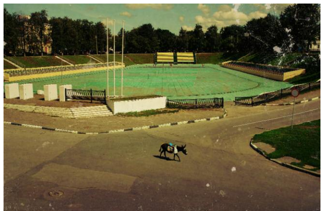
Pressebild 3 A donkey taking a lonely walk next to the municipal stadium of Yaroslavl