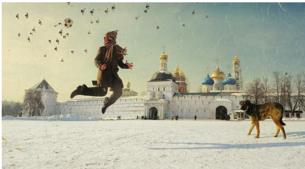
Pressebild 10 Self-portrait near to the Trinity Lavra of Saint Sergius [Sergiyev Posad, region of Moscow]