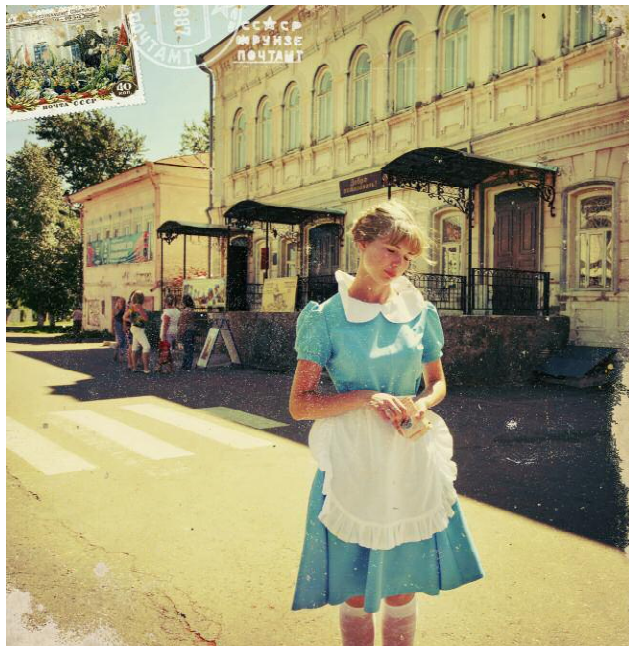
Pressebild 6 The tout in the tea shop at Kozmodemyansk [Mari El Republic]