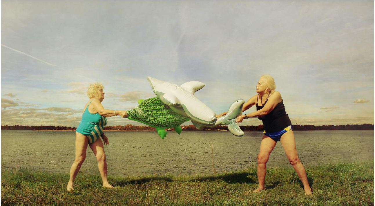
Pressebild 1 The friends play on the banks of the river of Moscow [region of Moscow]