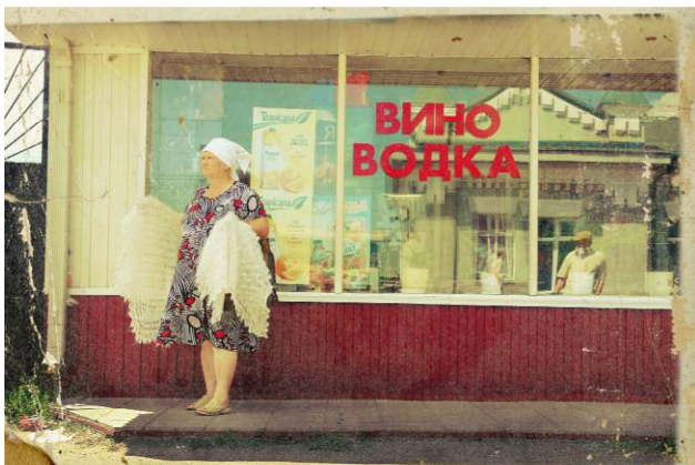
Pressebild 4 Babouchka sells angel wings next to the shop 'Vin Vodka' [Uryupinsk, region of Volgograd]