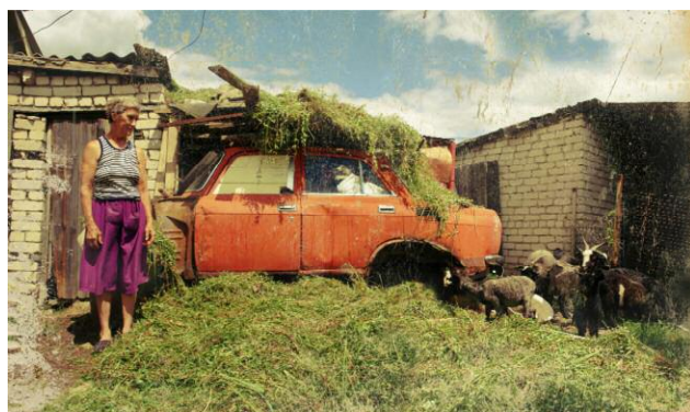
Pressebild 9 An old woman has filled her car with hay [Uryupinsk, region of Volgograd]