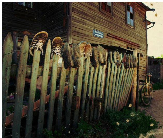
Pressebild 7 A big family at Sviyazhsk [Republic of Tatarstan]