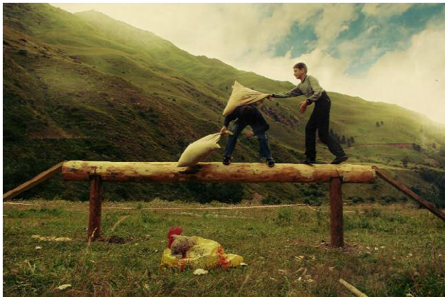
Pressebild 2 A well-behaved pillow fight to win the sacrificial cock [Kazbegi]