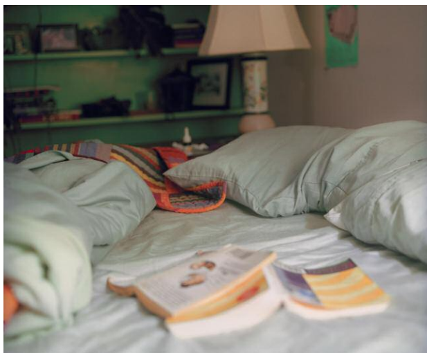
3. Insomnia