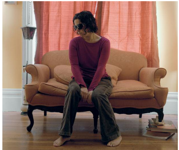
10. Untitled