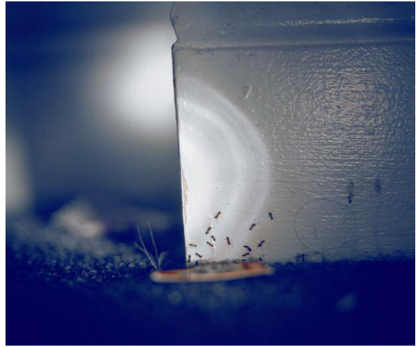
8. Swarm