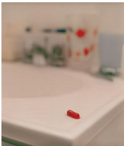
5. Melting