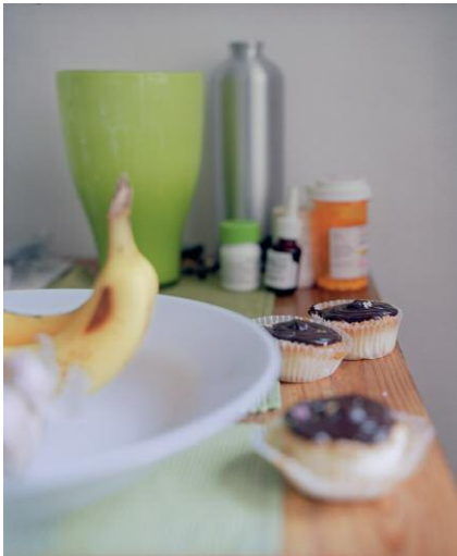
1. Birthday