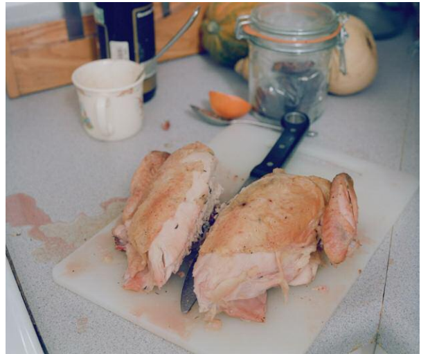
2. Heart