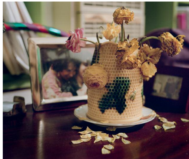
6. Memory