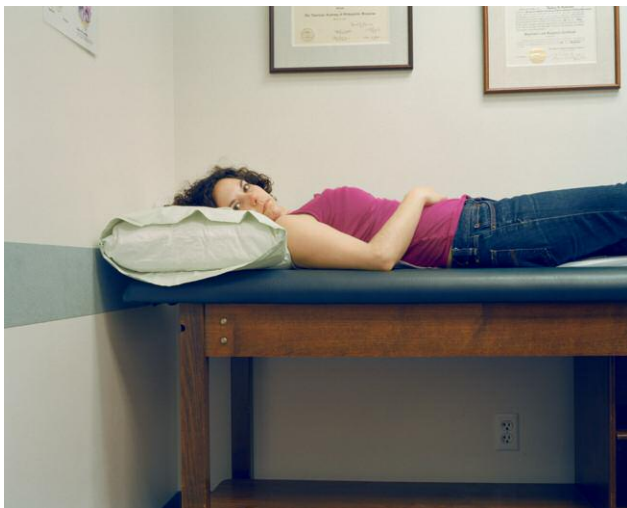
9. Untitled