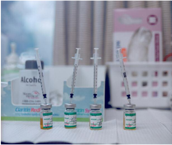
7. Sharp © RACHAEL JABLO