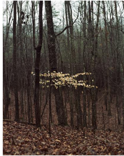
8. Talladega