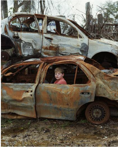
1. Merkel's Junkyard