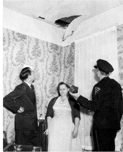
2. Ann