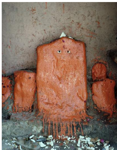
12. Hanuman