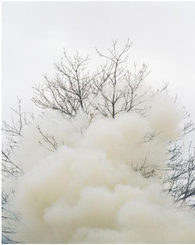
7. Smoke