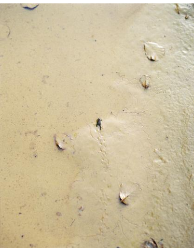
11. Frog