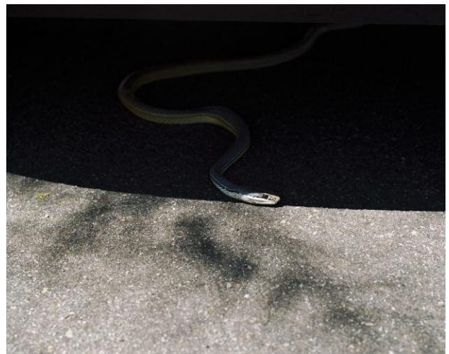
4. Serpent