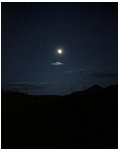
5. Oracle © Regine Petersen