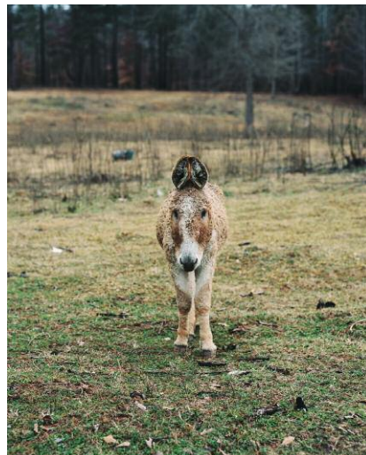
6. Mule © Regine Petersen