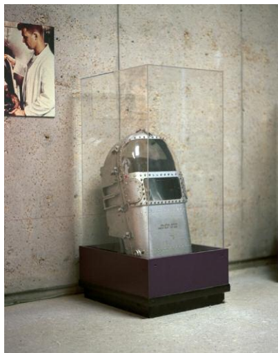
10. Chimpanzee Space Chamber