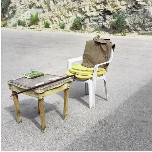
13. Amman (2012), photo.