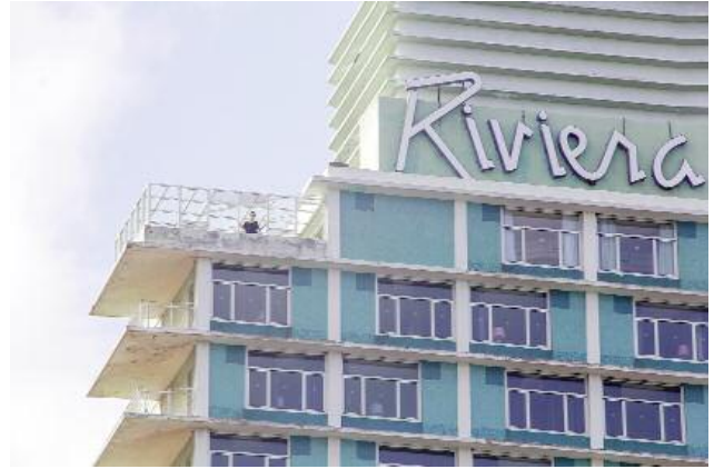
08_La Confesión (2015), film.