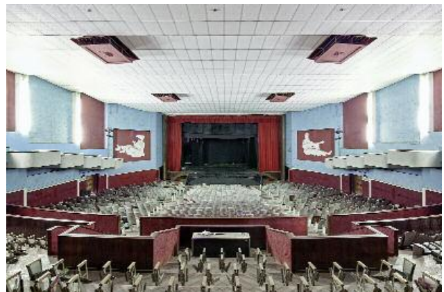
04_Interior Landscapes (2011 – 2014), photo.