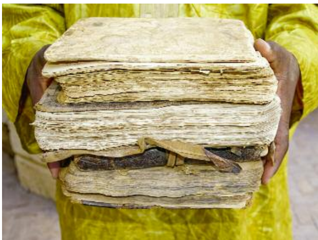
05_Manuscrits de Tombouctou (2009 – 2013)