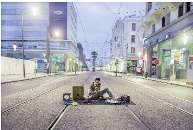
11_Rêveries urbaines (2014), photo.