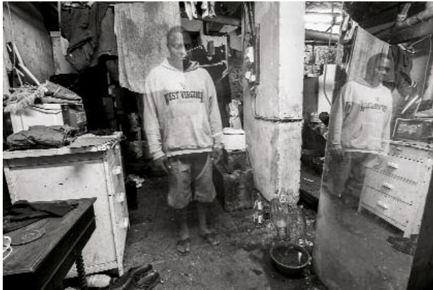
01_Ca va waka (2015), photo.