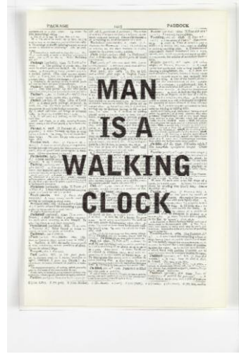
14. Second-Hand Reading (2013), vidéo. ©William Kentridge