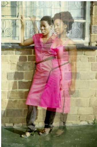
09_Her-Story, Ke Lefa Laka (2012 – 2013), photo. ©Lebohlang Kganye