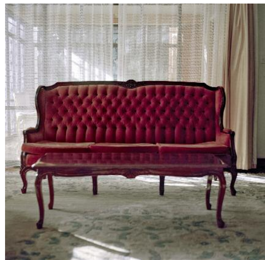
06_Do You Miss Me? Sometimes, Not Always (2015), photo. ©Mimi Cherono Ng'ok