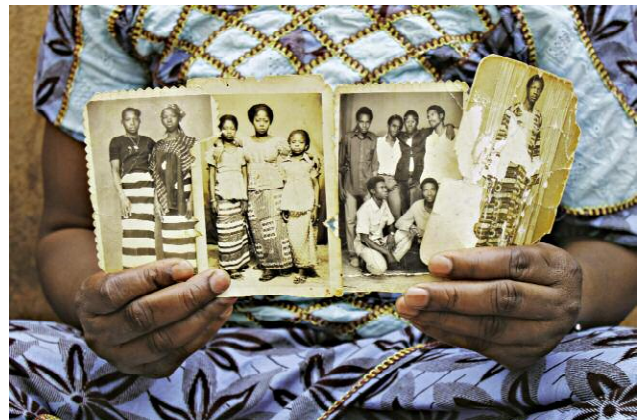
10_La métaphore du temps (2015), photo. ©Moussa Kalapo