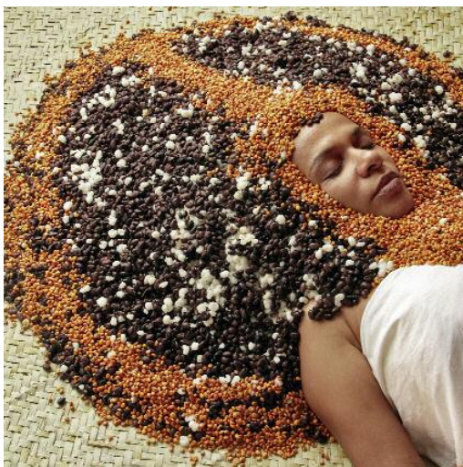
03_Bori – Offering to the Head (2008–2011), photo. ©Ayrson Heráclito