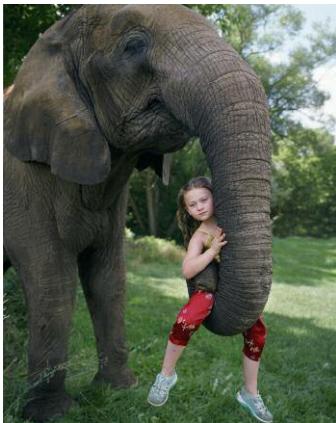
3. © Robin Schwartz