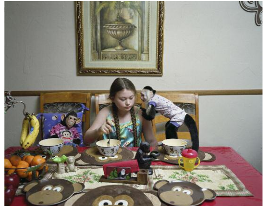
8. © Robin Schwartz