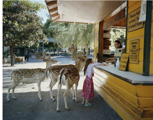
2. © Robin Schwartz