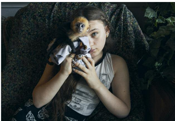
11. © Robin Schwartz