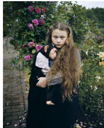
4. © Robin Schwartz