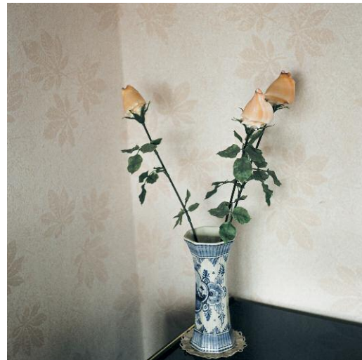
Intérieurs 2001