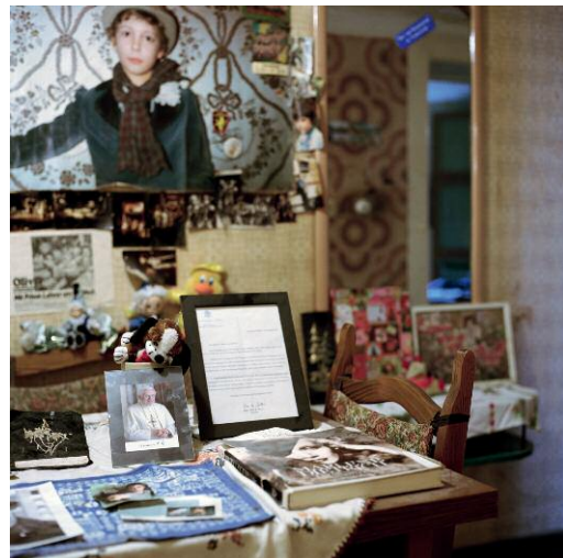
O. T. Berlin, Wilmersdorf 2012