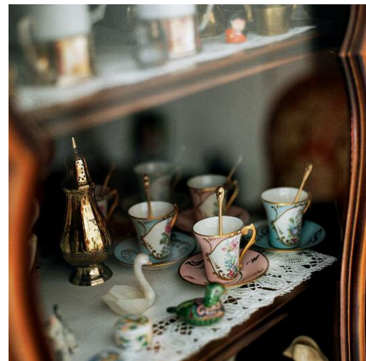
Intérieurs 2001