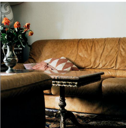
Intérieurs 2002 © 2013 ROSELYNE TITAUD