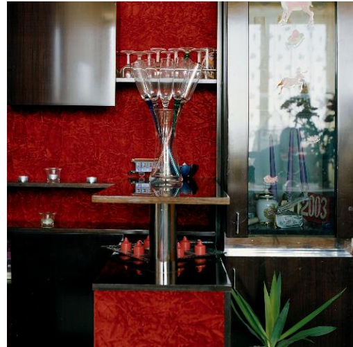
Arrangements Tour Plein-Ciel 2006