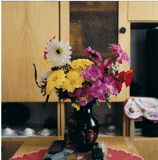
Arrangements 2004