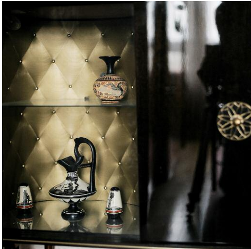
Intérieurs 2001