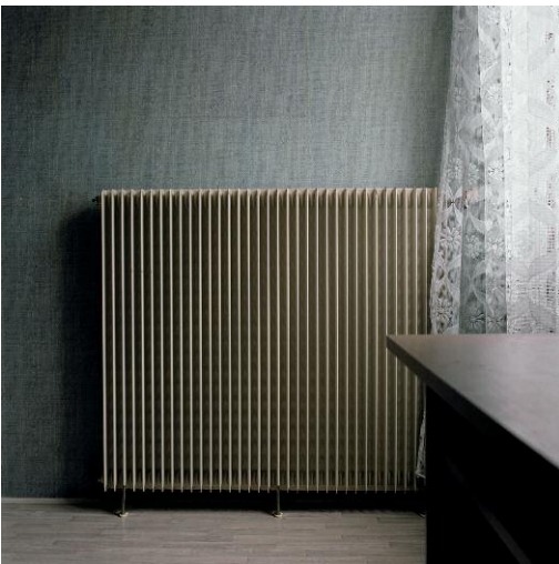
Vacuité 2007 © 2013 ROSELYNE TITAUD