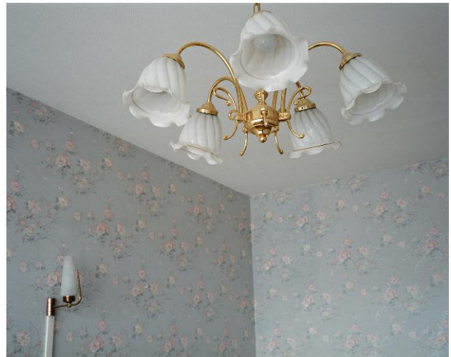
Vacuité 2006