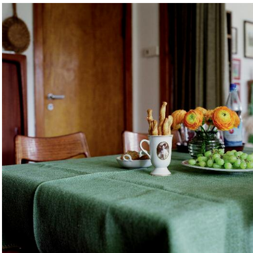
O. T. Berlin, Hermsdorf 2013