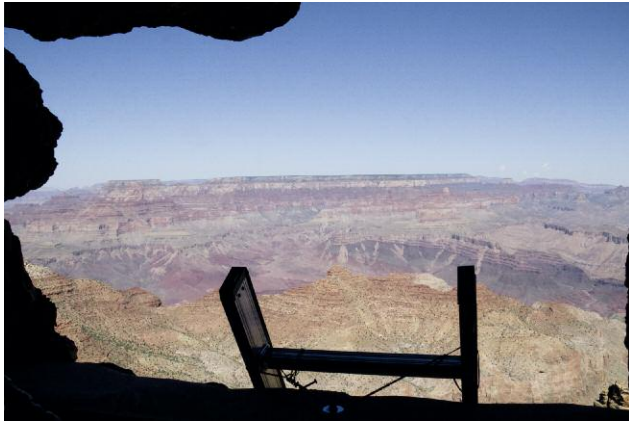
Wupatki, National Monument, Arizona