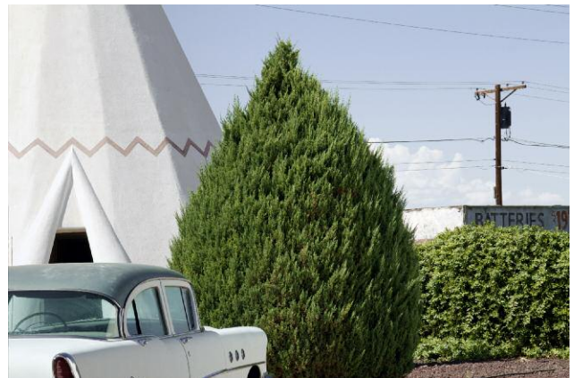
Wigwam Motel, Holbrook, Arizona