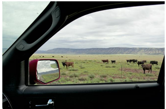
From Seligman to Peach Springs, Arizona