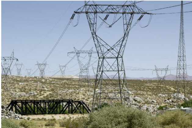
From Victorville to San Bernadino, California