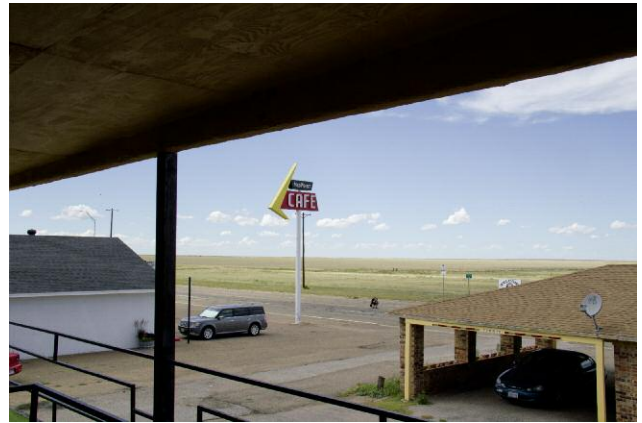
Midpoint Café, Adrian, Texas