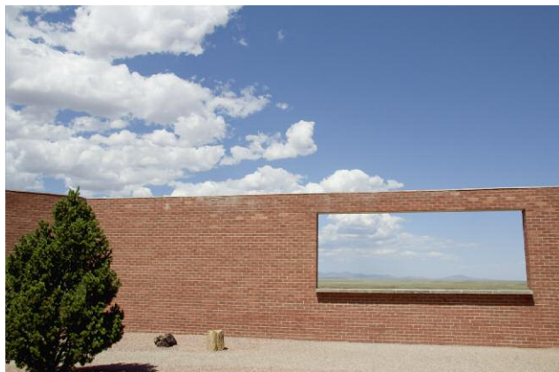
Meteor Crater from Visitor Center, east of Flagstaff, Arizona