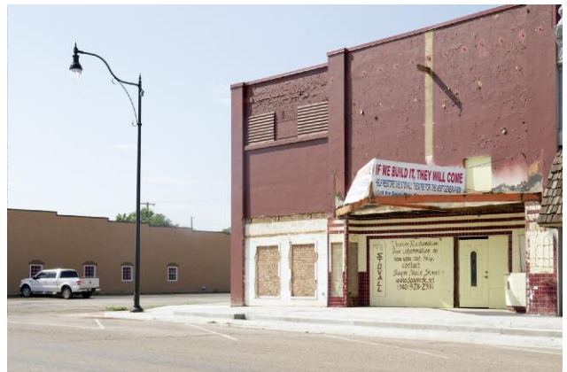
Stovall Theatre, Sayre, Oklahoma