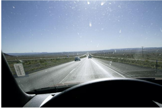
Toward Laguna, New Mexico