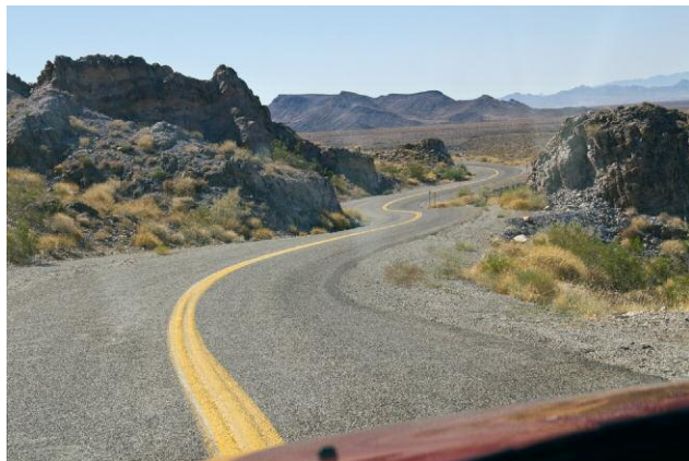
Goldroad from Ed's Camp to Oatman, Arizona