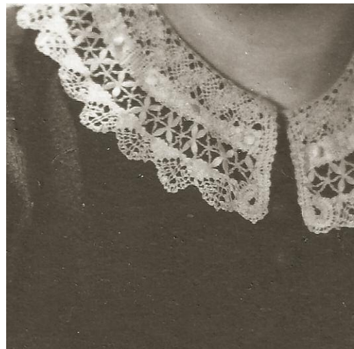
12 The Sea Remembers, Kehrer Verlag © Rosemarie Zens, 2014