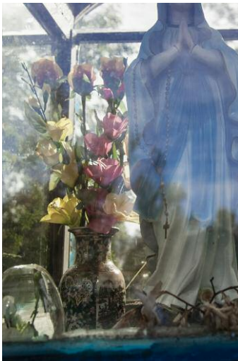
9 The Sea Remembers, Kehrer Verlag © Rosemarie Zens, 2014