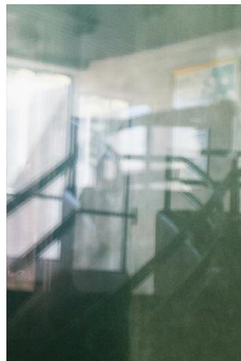
4 The Sea Remembers, Kehrer Verlag © Rosemarie Zens, 2014