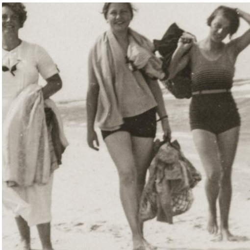
11 The Sea Remembers, Kehrer Verlag © Rosemarie Zens, 2014