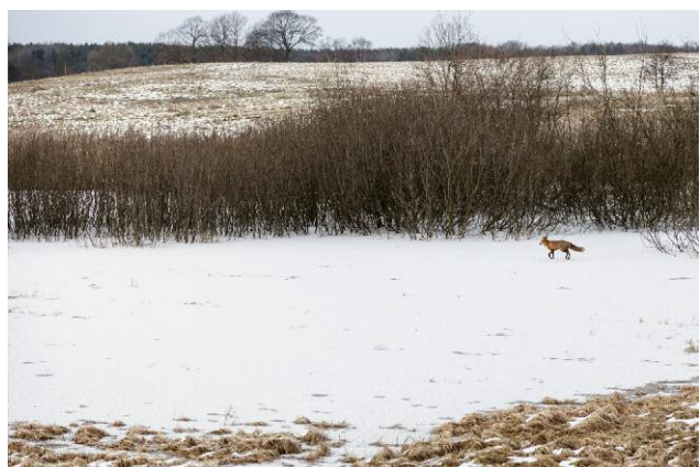
6 The Sea Remembers, Kehrer Verlag © Rosemarie Zens, 2014