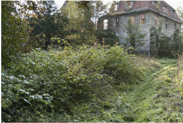
7 The Sea Remembers, Kehrer Verlag © Rosemarie Zens, 2014