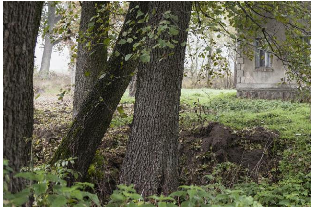
8 The Sea Remembers, Kehrer Verlag © Rosemarie Zens, 2014