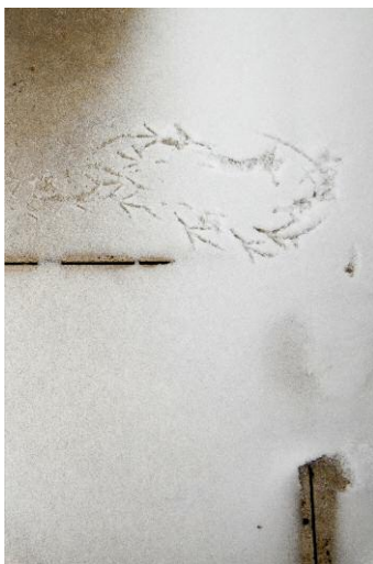
5 The Sea Remembers, Kehrer Verlag © Rosemarie Zens, 2014