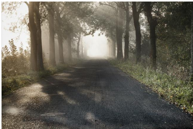
3 The Sea Remembers, Kehrer Verlag © Rosemarie Zens, 2014