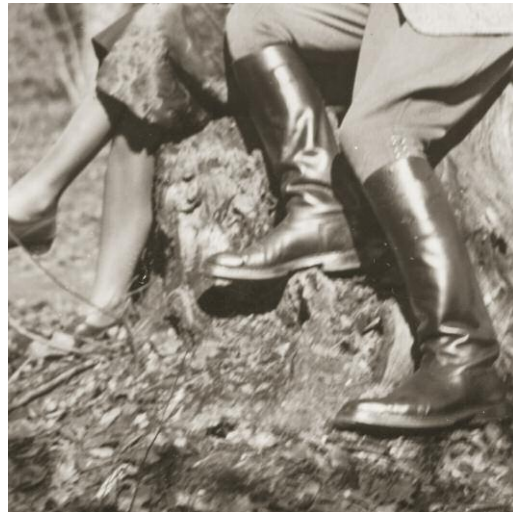
2 The Sea Remembers, Kehrer Verlag