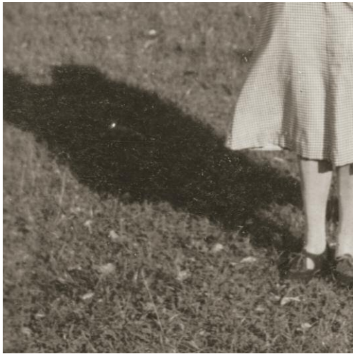
1 The Sea Remembers, Kehrer Verlag © Rosemarie Zens, 2014