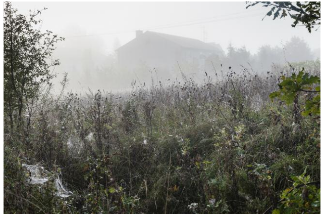
10 The Sea Remembers, Kehrer Verlag © Rosemarie Zens, 2014