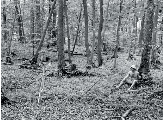
07_Native (Beim Fotografieren / Taking my Picture), 2000