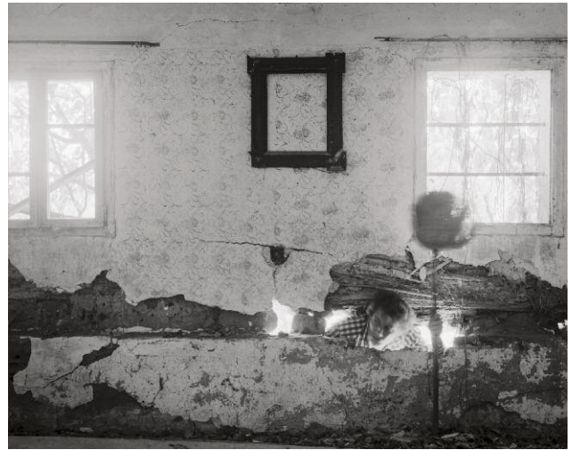
10_Pictures Inside Me (Im Wandriss / In the Wall Crack), 2013, Ultrachrome- Print auf Gewebeplane / on tarpaulin, 140 x 198 cm ©Sebastian Kusenberg