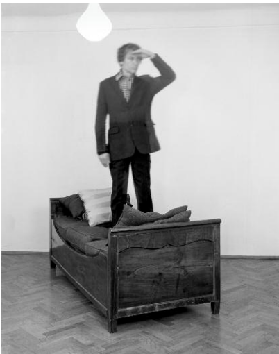
09_Pictures Inside Me (Auf dem Bett / On the Bed), 2013, Ultrachrome-Print auf / on Tyvek 170 x 135 cm