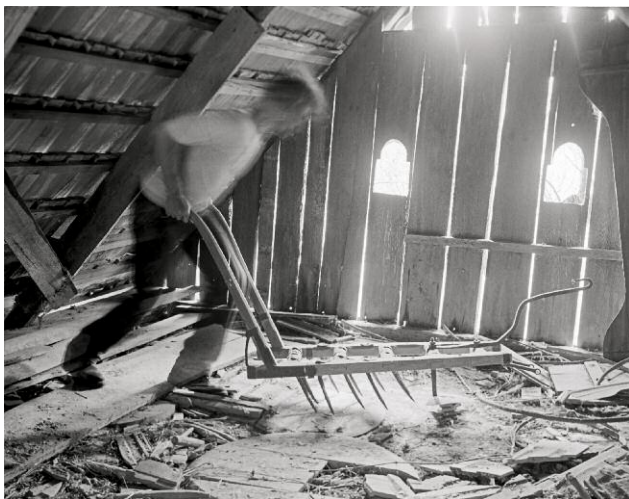
11_Pictures Inside Me (Egge schiebend / Pushing the Harrow), 2013, Baryt-Print / Fibre-type print 99 x 127 cm, im Vitrinenrahmen / in box frame 109 x 140 cm