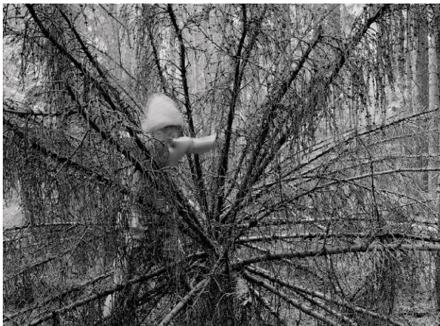
05_Native (In der Fichtenkrone / In the Top of a Spruce), 2000, Baryt-Print / Fibre-type print 96 x 125 cm, im Vitrinrahmen / in box frame 105 x 136 cm ©Sebastian Kusenberg