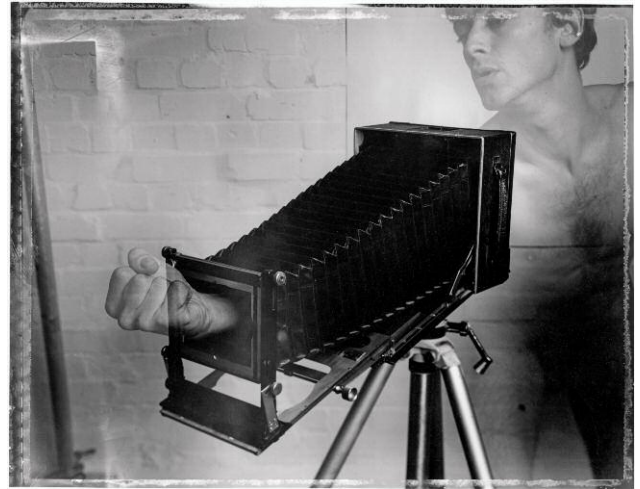
04_Durch die Kamera / Through the Camera, 1988, Baryt-Print / Fibre-type print 20 x 29 cm