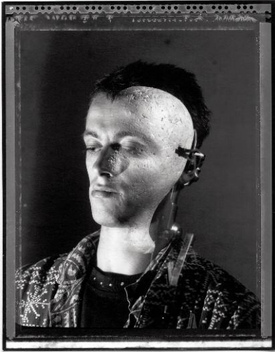
01_Vier Doppelbelichtungen mit Styroporkopf / Four Double Exposures with Styrofoam Head, 1991, Baryt-Prints auf Holz kaschiert / Fibre-type-prints mounted on wood, je / each 104 x 75 cm ©Sebastian Kusenberg