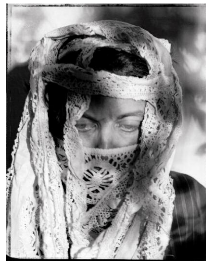
06_Mit Burka / With Burka, 2007, Baryt-Print / Fibre-type print 100 x 80 cm