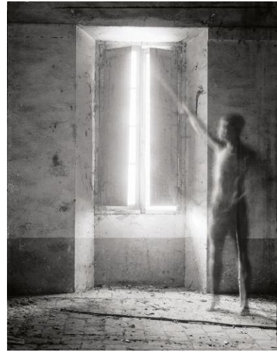
08_La Palazzina (Am Fenster / At the Window), 1987, Baryt-Print / Fibre-type print 100 x 78 cm