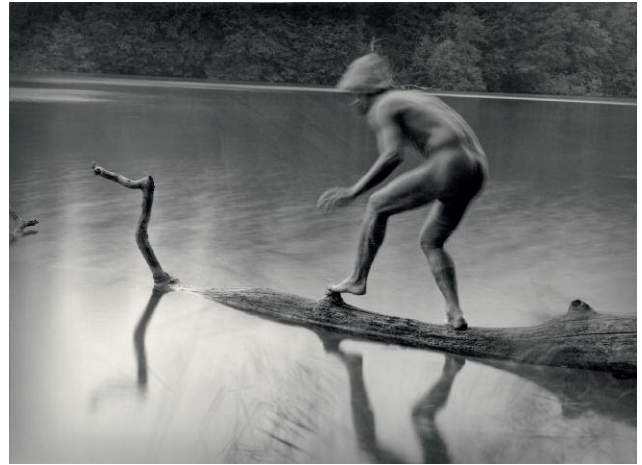
02_Native (Auf einem Baumstamm / On a Tree Trunk), 2000, Baryt-Print / Fibre-type print 96 x 125 cm, im Vitrinrahmen / in box frame 105 x 136 cm