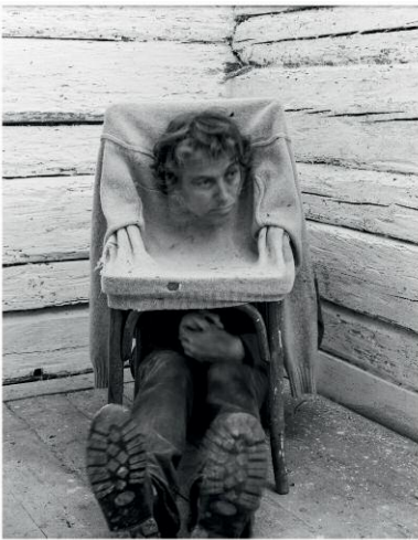
03_Pictures Inside Me (Im Stuhl / In the Chair), 2013, Ultrachrome-Print 127 x 99 cm, im Vitrinrahmen / in box, frame 140 x 109 cm ©Sebastian Kusenberg