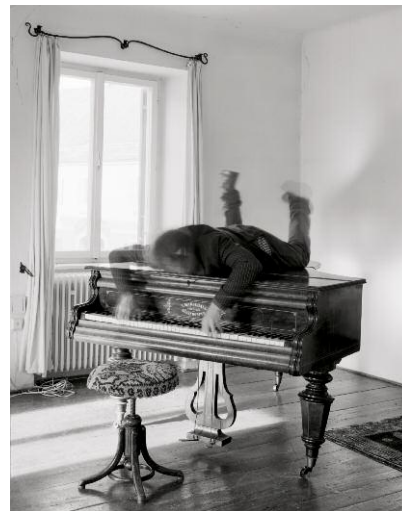
12_Pictures Inside Me (Auf dem Flügel / On the Grand Piano), 2013, Ultrachrome-Print auf / on Tyvek, 170 x 135 cm ©Sebastian Kusenberg