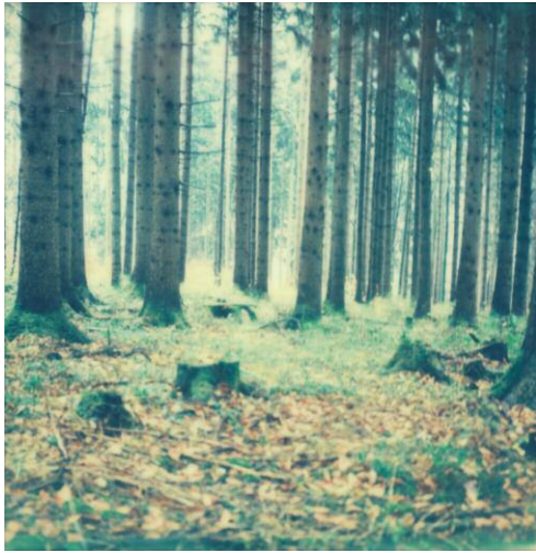
o7_Wald © SIMON FRÖHLICH