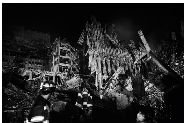
10. North Tower