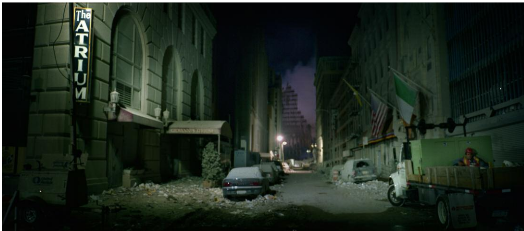
2. Washington Street