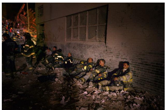
4. Greenwich Street and Liberty Street. South Side of Ground Zero