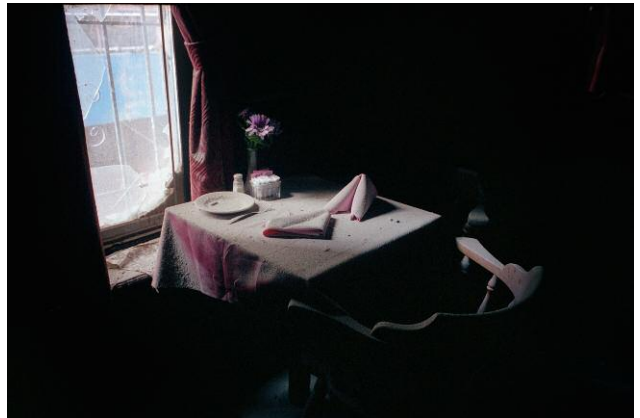
8. O'Hara's Restaurant and Pub, Greenwich Street