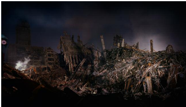
7. North Tower