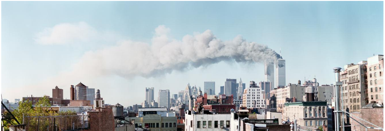
1. Twin Towers