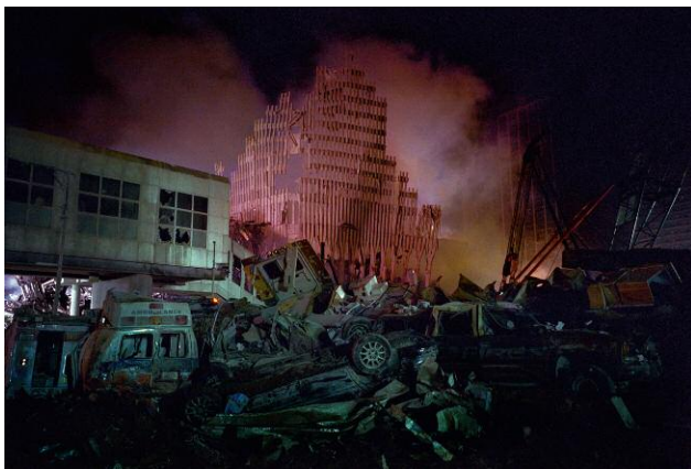
3. West Street and Liberty Street. Southwest Side of Ground Zero