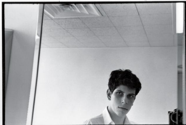
Self Portrait, New York City, 1964