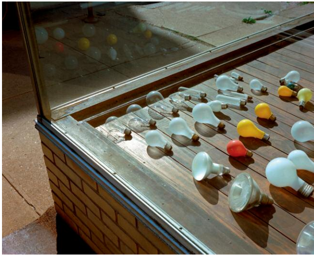
West Third Street, Parkersburg, West Virginia, May 16, 1974