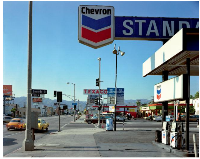
Beverly Boulevard and La Brea Avenue, Los Angeles, California, June 21, 1975