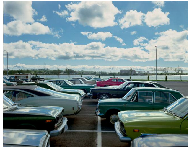
Sault Ste. Marie, Ontario, August 13, 1974 © STEPHEN SHORE