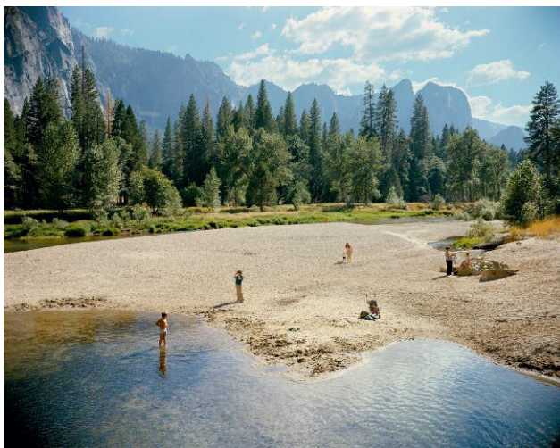
Merced River, Yosemite National Park, California, August 13, 1979