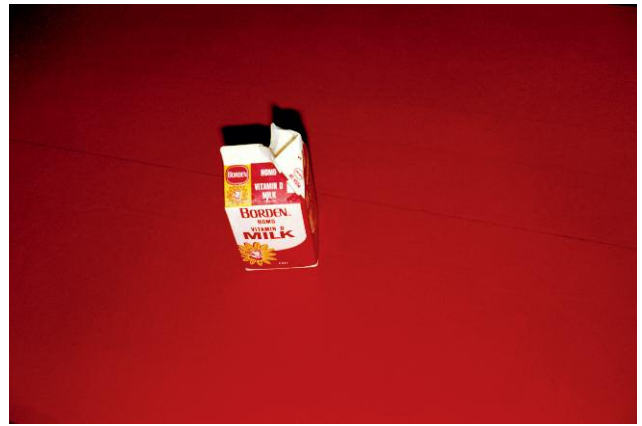
Amarillo, Texas, July, 1972