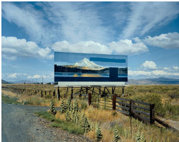
U.S. 97, South of Klamath Falls, Oregon, July 21, 1973