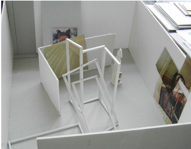
01_ Triangel of Need, Modell für eine Installation, Entwurf, 2012/2013 © SUSAN TEMPLIN