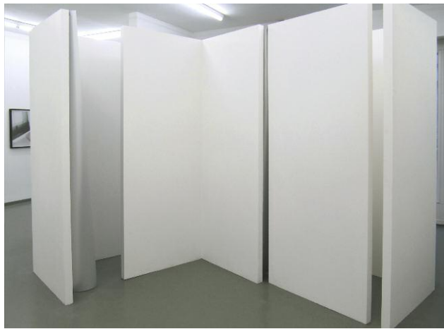
09_ Totale Wohnung, Ausstellungsansicht, Galerie Rasche Ripken, Berlin, 2011