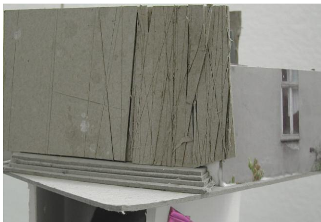
09_ Geometry of Space, 2008-2010