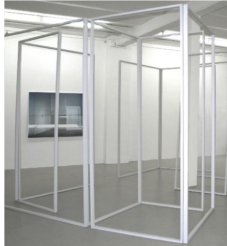
02_ Apartment, Ausstellungsansicht, Galerie Hanfweihnacht, Frankfurt/Main, 2013 © SUSAN TEMPLIN