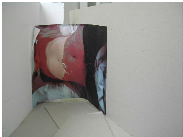
06_ Real Estate, Modell für eine Installation, 2010 © SUSAN TEMPLIN