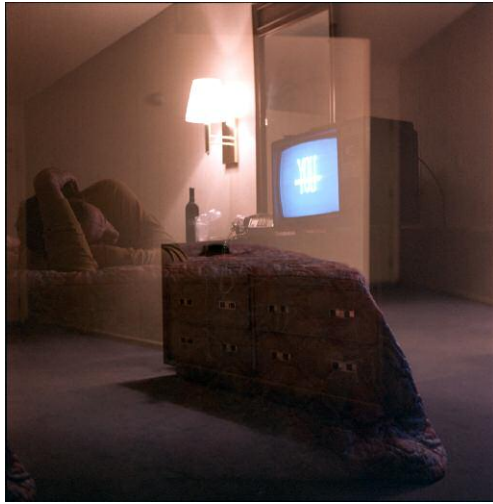
07_ Room #8, 2010 © SUSAN TEMPLIN