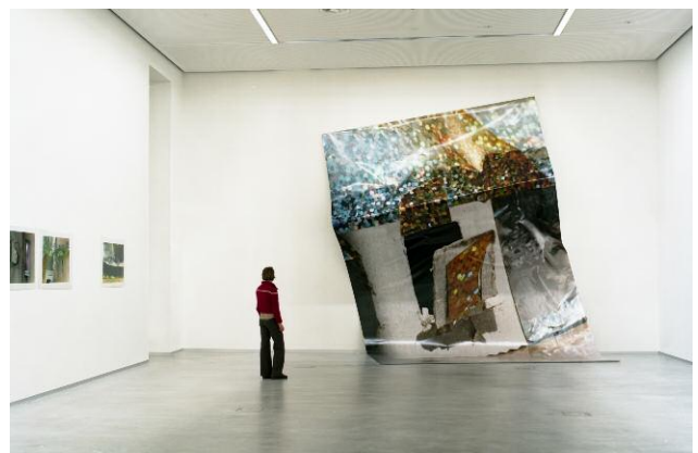
10_ BerlinBarock, Ausstellungsansicht, Berlinische Galerie, Museum für Moderne Kunst, Berlin, 2007