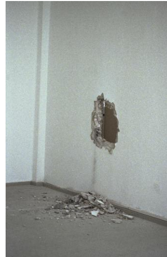
10_ Geometry of Space, 2008-2010