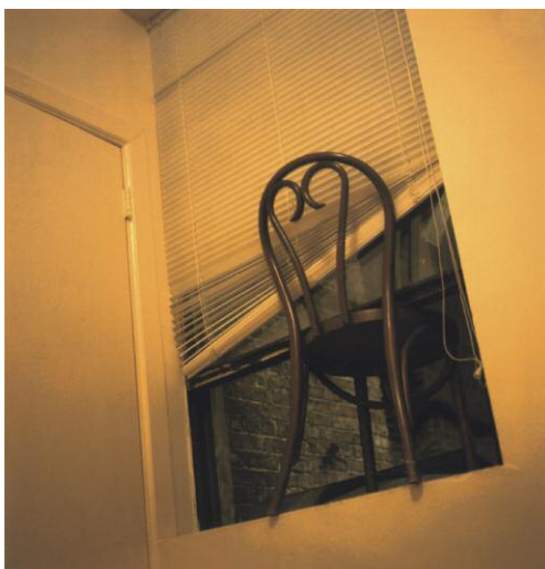
05_ Stuhl, Fenster, Sommer, Nachts, 2008 © SUSAN TEMPLIN