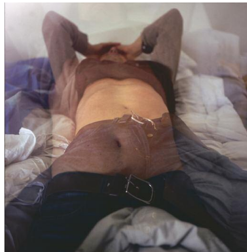
04_ Double Room, 2009 © SUSAN TEMPLIN