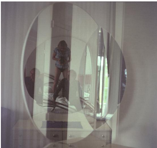
03_ Geometrie des Raumes, 2011 © SUSAN TEMPLIN