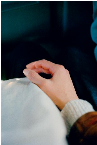
9_Peach, Kehrler Verlag © 2014 SUSANNE HEFTI