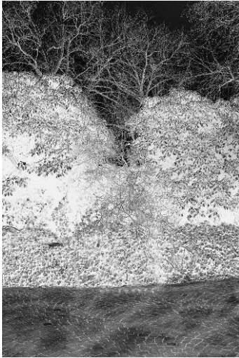
1_Peach, Kehrler Verlag © 2014 SUSANNE HEFTI