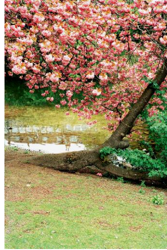
8_Peach, Kehrler Verlag © 2014 SUSANNE HEFTI