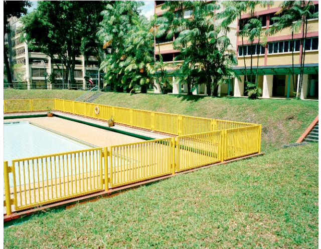
2_Peach, Kehrler Verlag © 2014 SUSANNE HEFTI