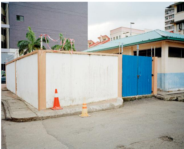
5_Peach, Kehrler Verlag © 2014 SUSANNE HEFTI