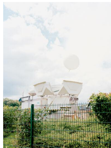
6_Peach, Kehrler Verlag © 2014 SUSANNE HEFTI