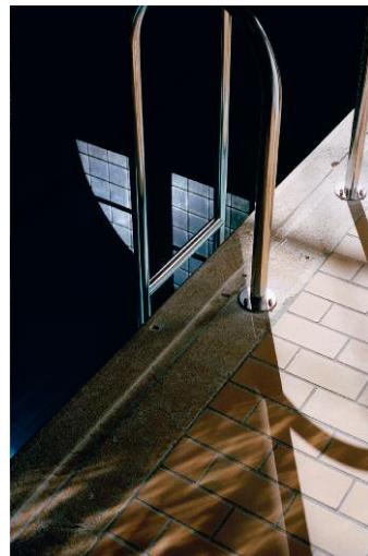
4_Peach, Kehrler Verlag © 2014 SUSANNE HEFTI