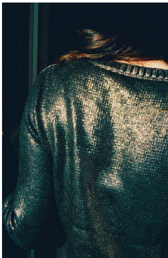
3_Peach, Kehrler Verlag © 2014 SUSANNE HEFTI