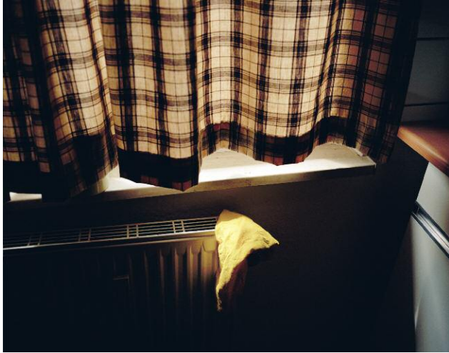
7_Peach, Kehrler Verlag © 2014 SUSANNE HEFTI